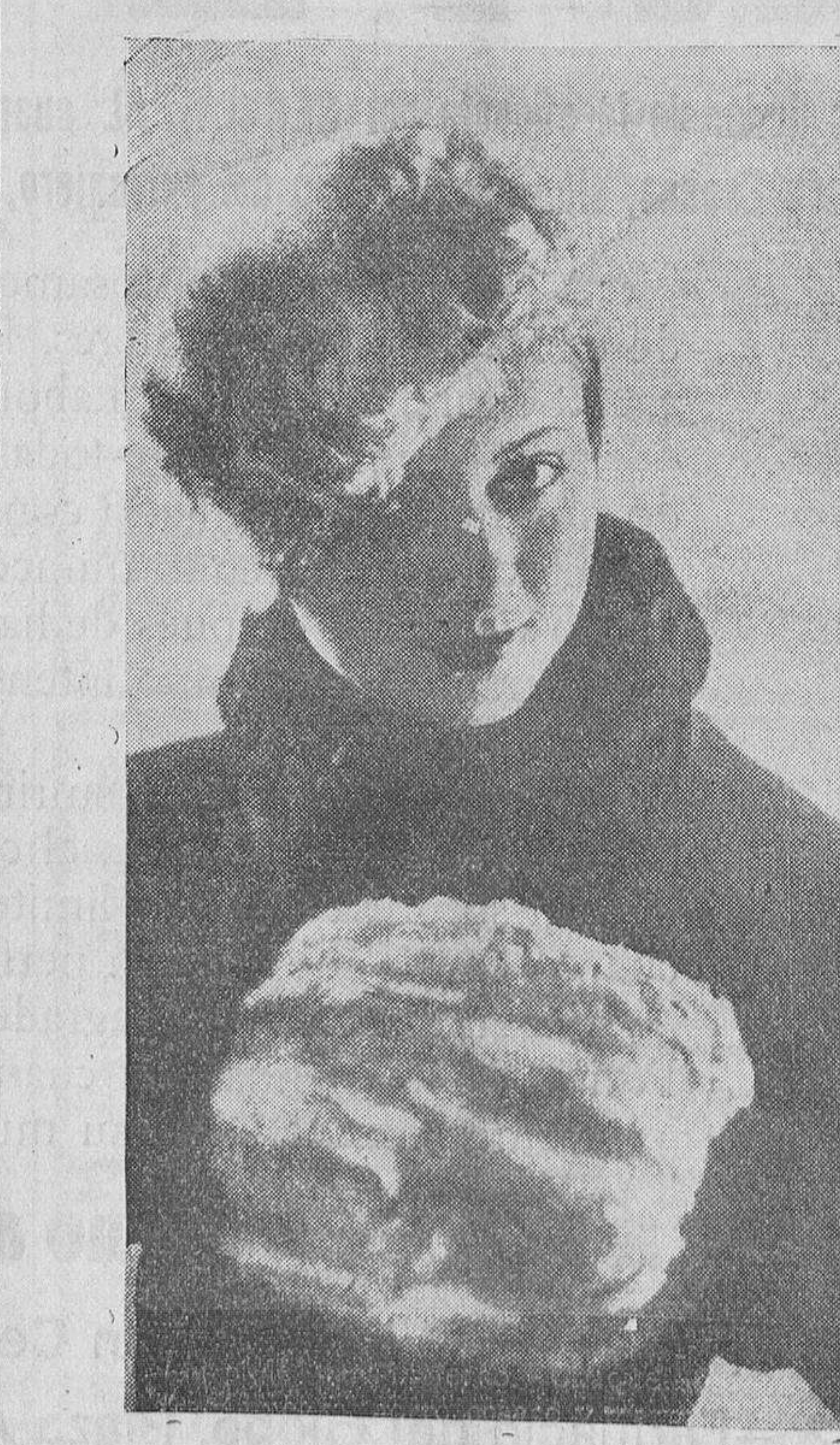
Las pieles para invierno.— Chaqueta corta de astracán negro, gorro cosaco y manguito de «petit-gris».