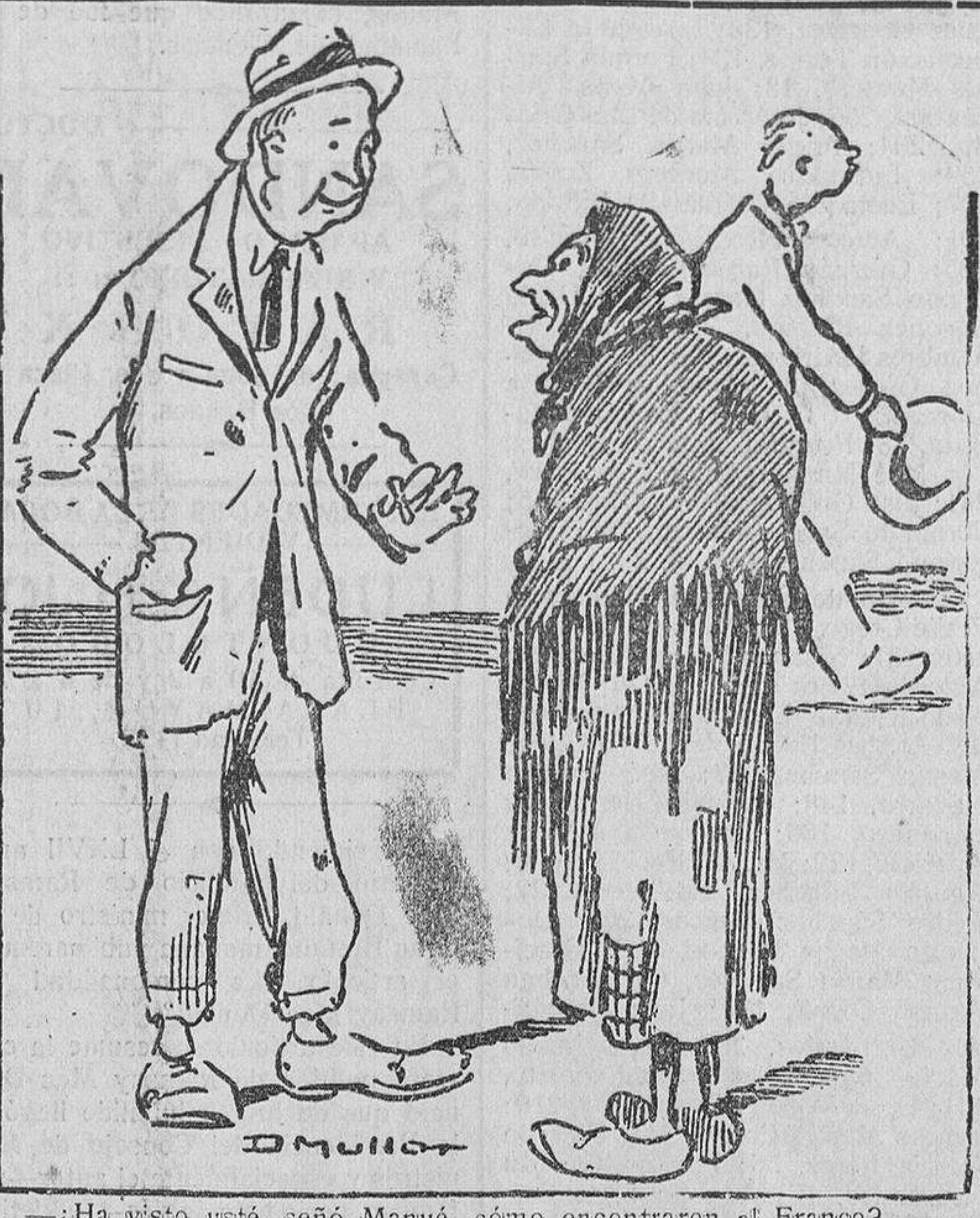
—¿Ha visto usted, señá Manué, cómo encontraron al Franco? —Eso ha sido fácil. Lo difícil es encontrar la peseta...

Instrucción pública Sin discusión se aprobó un dictamen de la Comisión sobre crea-