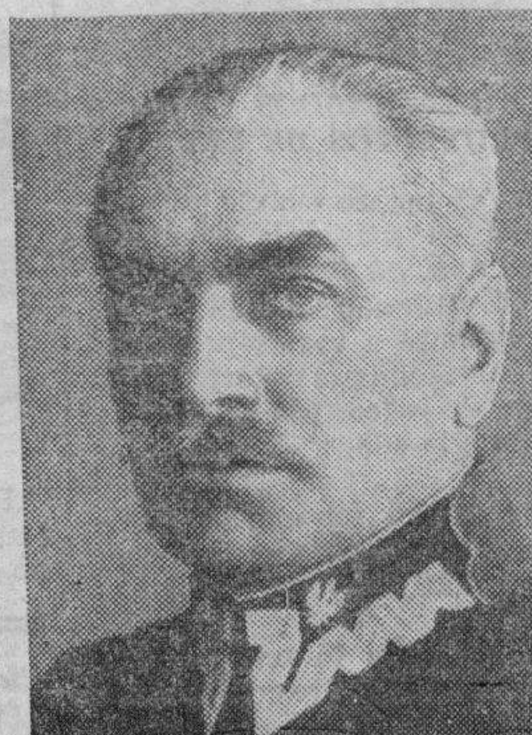
GENERAL SKLADKOWSKI Nuevo jefe del Gabinete de Polonia