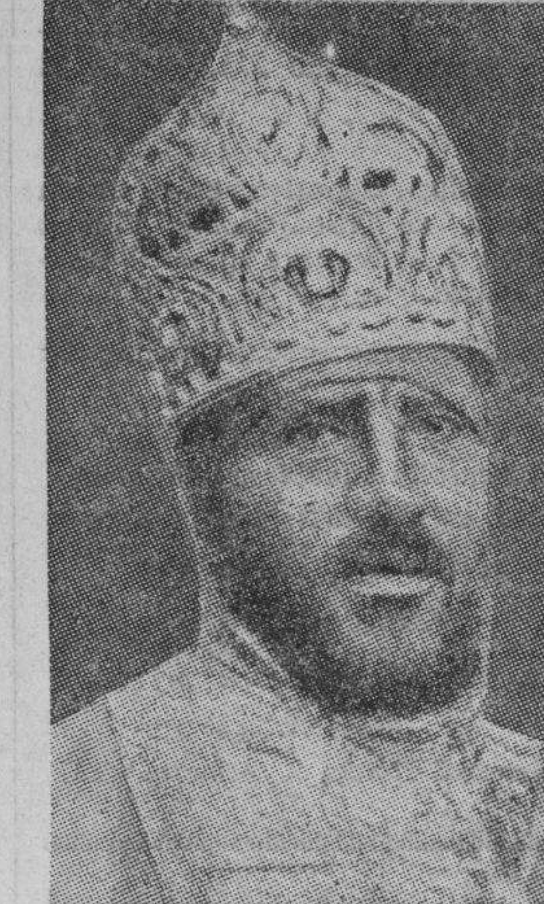
RAS KASSA el renombrado jefe del ejército del norte de Etiopía, que según las últimas noticias se retiró en perfecto orden hacia los desfiladeros de Tembien