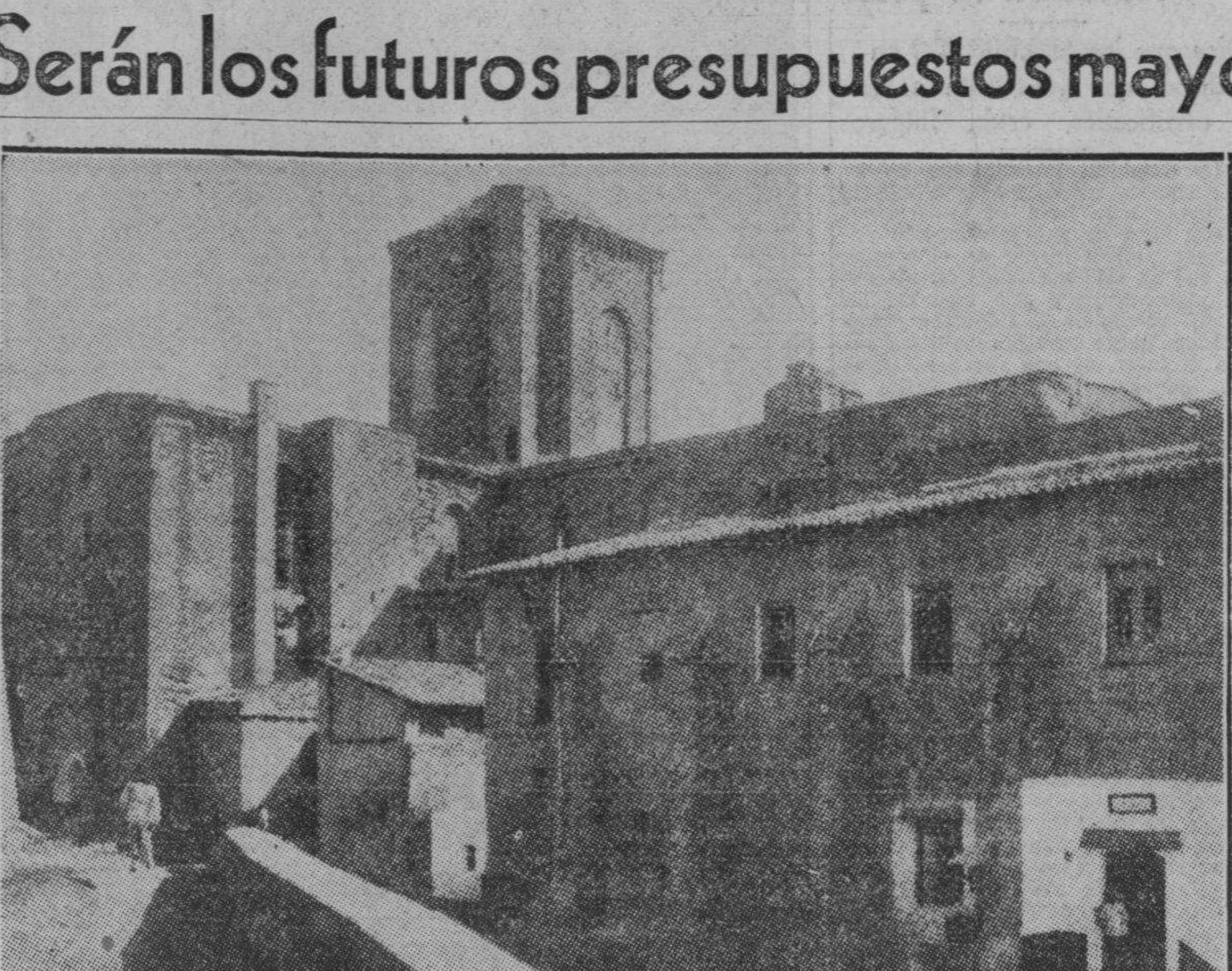
Ya las enseñanzas nacionalistas ondean en los edificios de la capital provincial de Lérida. En este Palacio-municipio, conocido por «la catedral vieja», construido en el Siglo XIII, las fuerzas del gobierno rojo de Barcelona hicieron el último y desesperado esfuerzo por detener la heroica acometida de los soldados del general Yagüe. Durante la guerra carlista, el edificio fué convertido en fortaleza y últimamente servía de cuartel de infantería a las fuerzas de la provincia. Situado en el centro de la ciudad, su construcción de piedra en baluarte. Pero los soldados de España en su asalto de ayer, conquistándolo y ocupando la ciudad, han demostrado que sólo los que saben defender un Alcázar son los que saben también rendir otro.

El general Miaja, comandante de las fuerzas del Centro, publicó una proclama en relación con las actividades de sus tropas en el frente de Guadalupe.