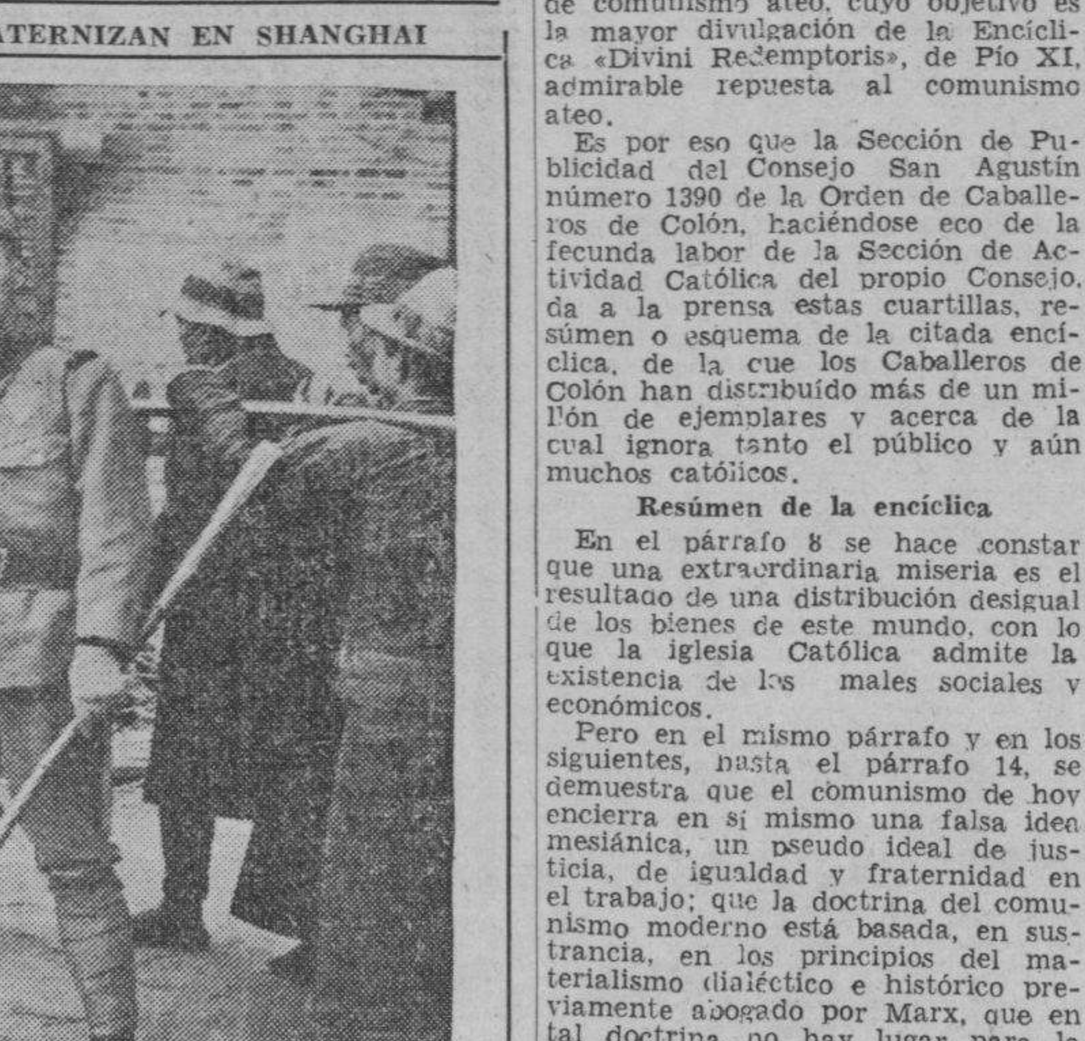
INGLESES Y JAPONESES FRATERNIZAN EN SHANGHAI. Con la guerra chino-japonesa ya muy lejos del París del Este, estos soldados japoneses e ingleses conversan amigablemente.