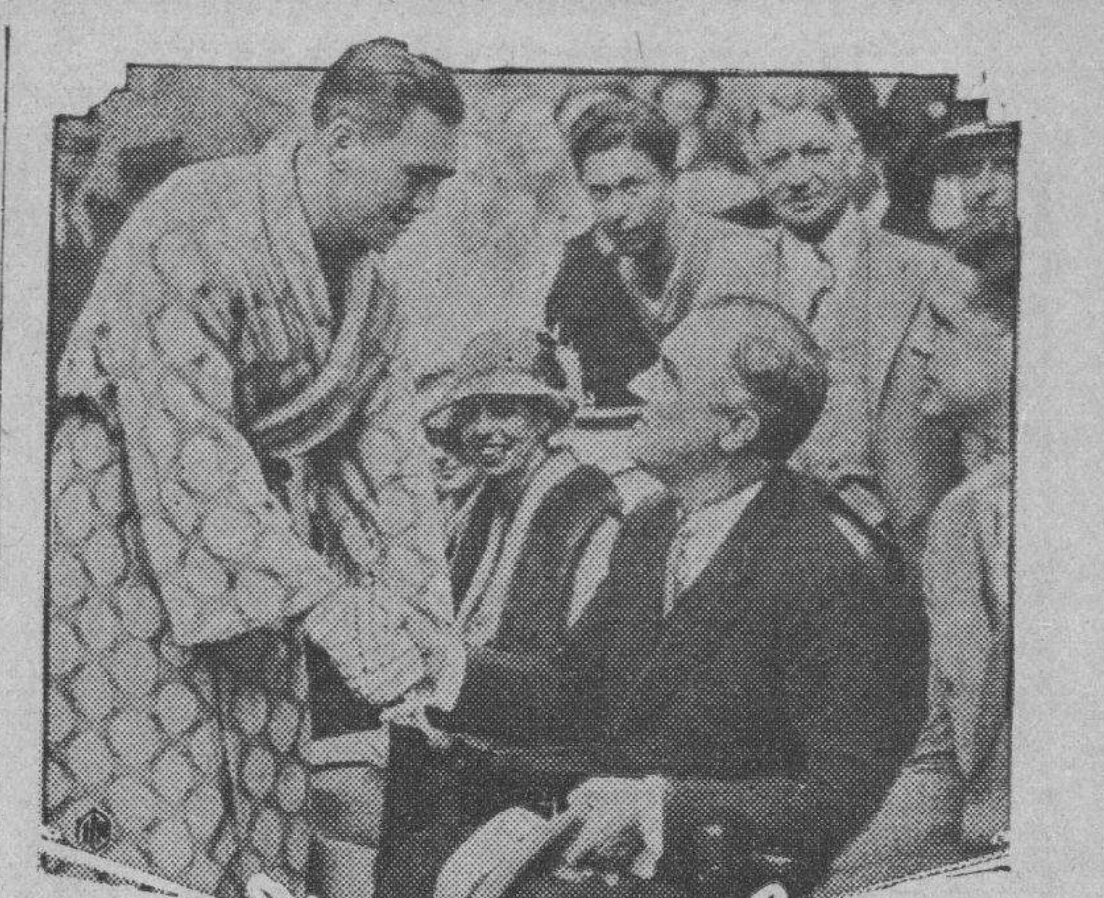
Dos señores que esperan sentarse en el «top of the world», haciendo época en los anales de la historia americana, se saludaron cortésmente en días pasados. Max Schmeling, campeón mundial de los pesos completos, recibió la visita de Franklin Roosevelt, gobernador de New York, en su campo de entrenamiento de Kingston, N. Y. Schmeling espera defender con éxito su corona mundial a fines de este mes frente a Sharkey, y Roosevelt espera defender con igual éxito su aspiración presidencial en la convención del Partido Democrático.

POQUE LO EXTRAORDINARIAMENTE BUENO, ESTA SIEMPRE DE MODA