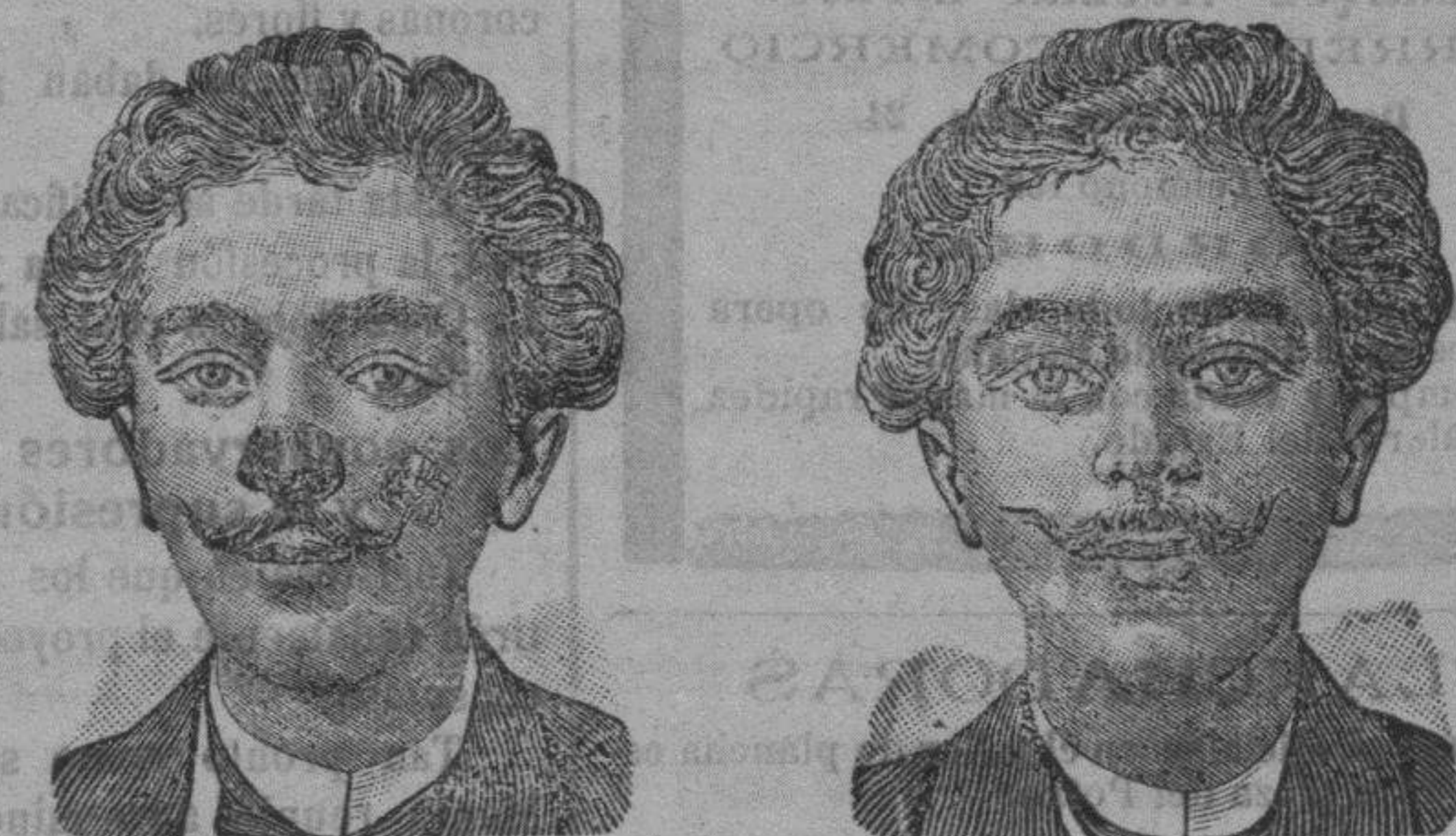
Antes de la curación.