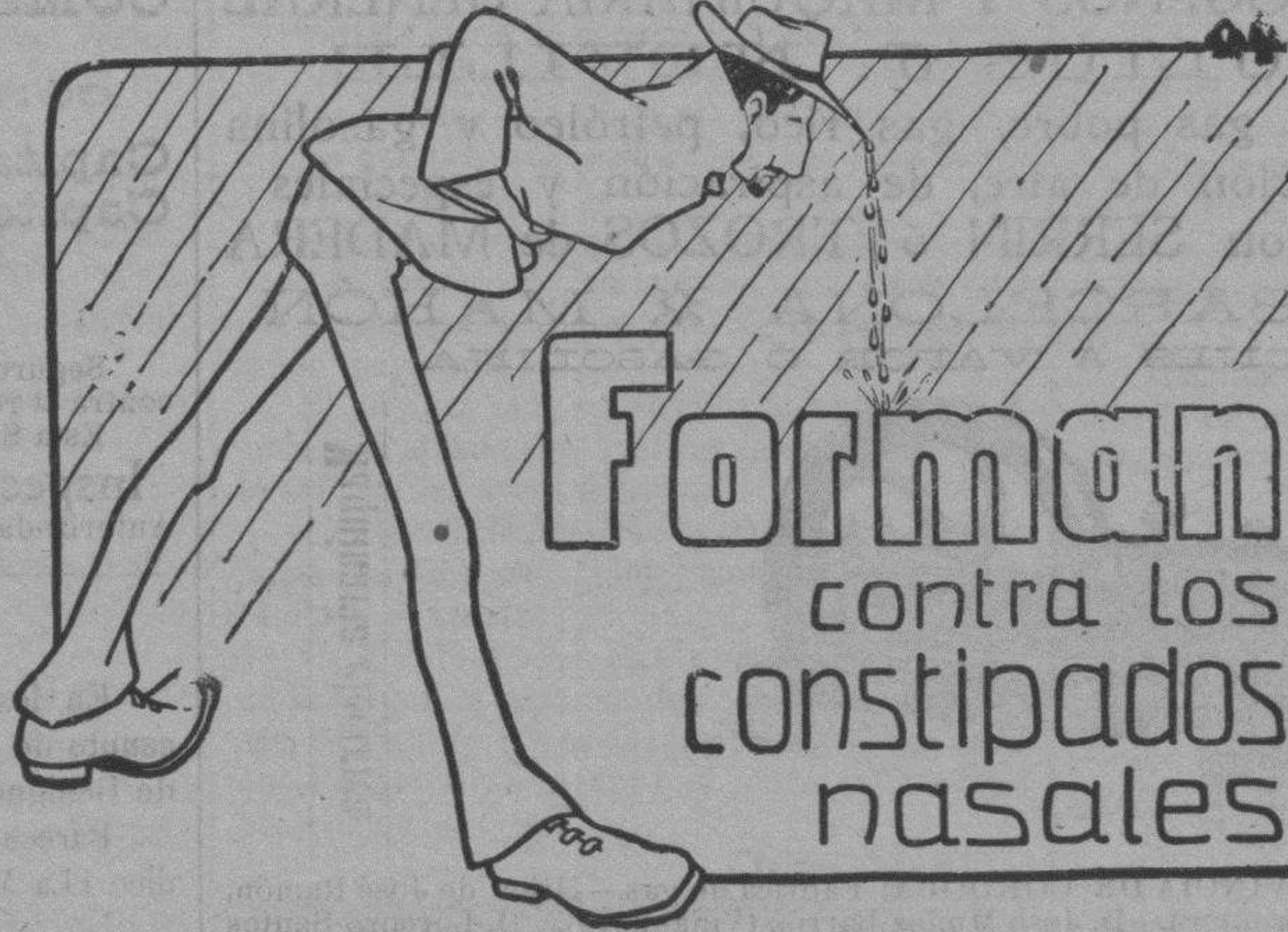
Precio de la caja, 0'75 pesetas. De venta en Farmacias.