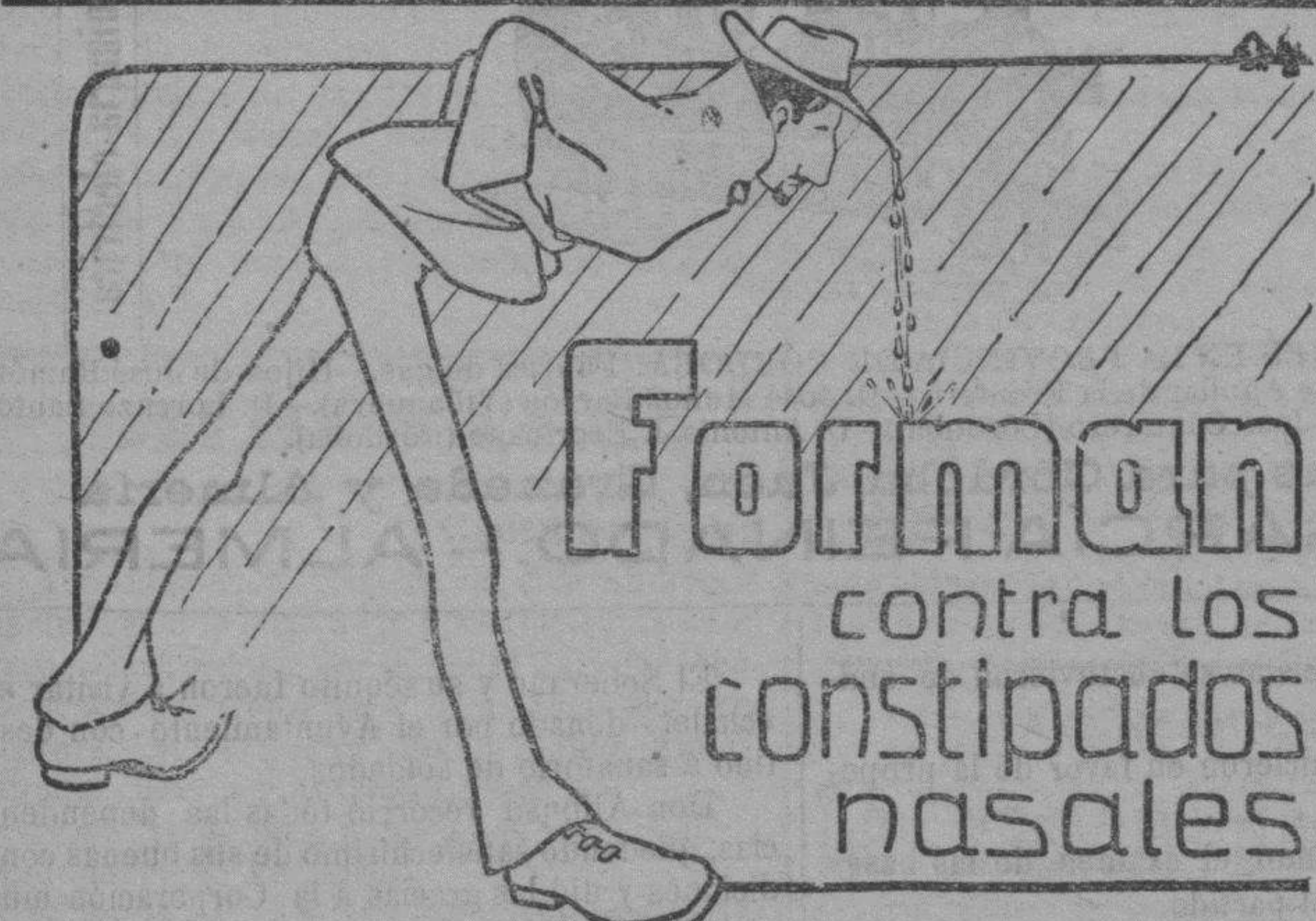
Precio de la caja, 0'75 pesetas. De venta en Farmacias.

Timbre que llevan en las cubiertas los Chocolates de Confianza de Hijos de Demetrio Cabrera. Suplicamos á nuestros clientes se fijen bien, á fin de evitar equivocaciones. También invitamos al público en general á que visite nuestra fábrica para que vea por sí tanto lo higiénico de nuestros locales y aparatos, como los productos que se emplean en la elaboración de nuestros chocolates.