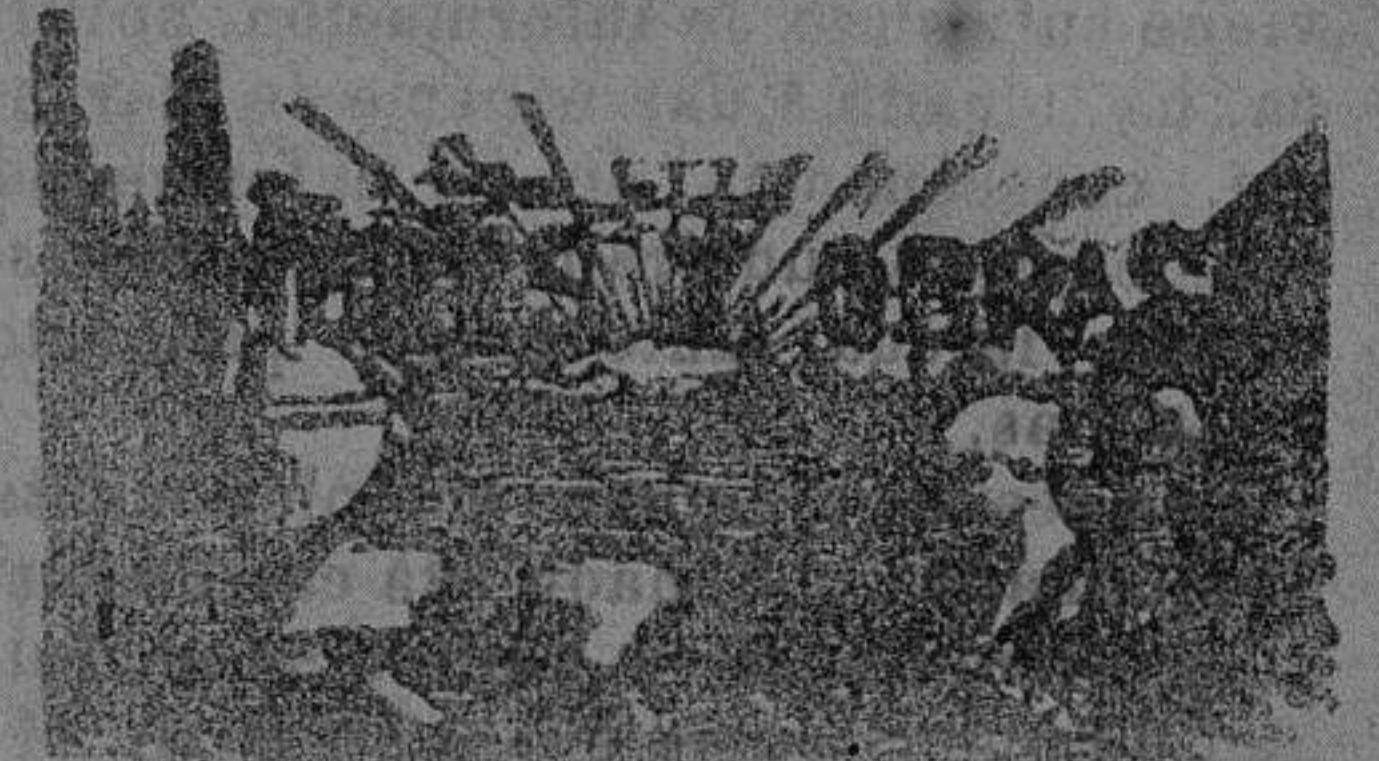
GREGORIO VERDÚ Y VERDÚ