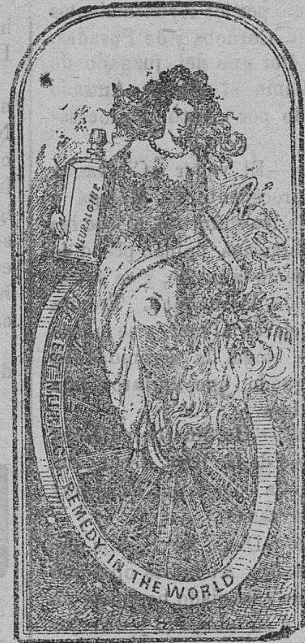
BÁLSAMO DE NEURALGIE