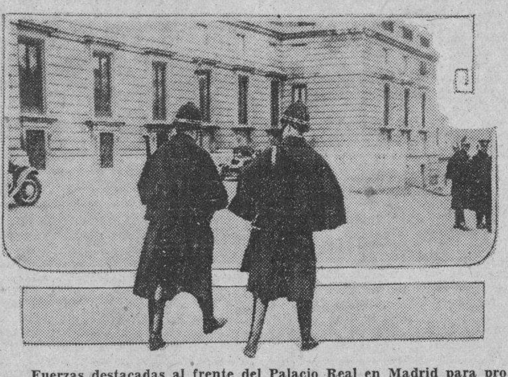
Fuerzas destacadas al frente del Palacio Real en Madrid para proteger al Rey contra los posibles ataques de la agitación política imperante en España.

Dijeron al ministro que ya organizaron la enseñanza