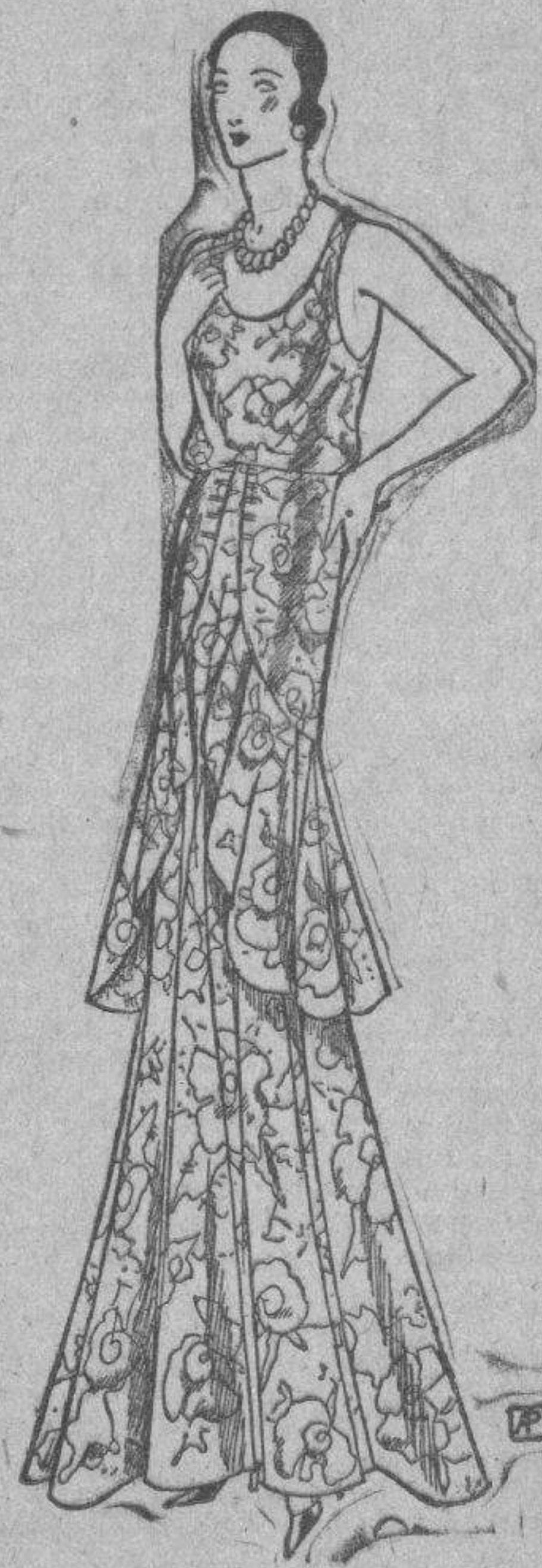
Modelo de Alex—Distinguido traje de baile en satén blanco brocado con figuritas de oro y pliegue hasta las rodillas.

La Insuñ... Es la insuñ una flor de suavísimo color y de dulcísimo aroma... Es la insuñ una flor donde palpita el amor, donde la dicha se asoma. Más, no aspiras demasiado su perfume embalsamado, penetrante... embriagador... que en su cáliz delicado suele ocultarse guardado, tras de la dicha, el dolor.