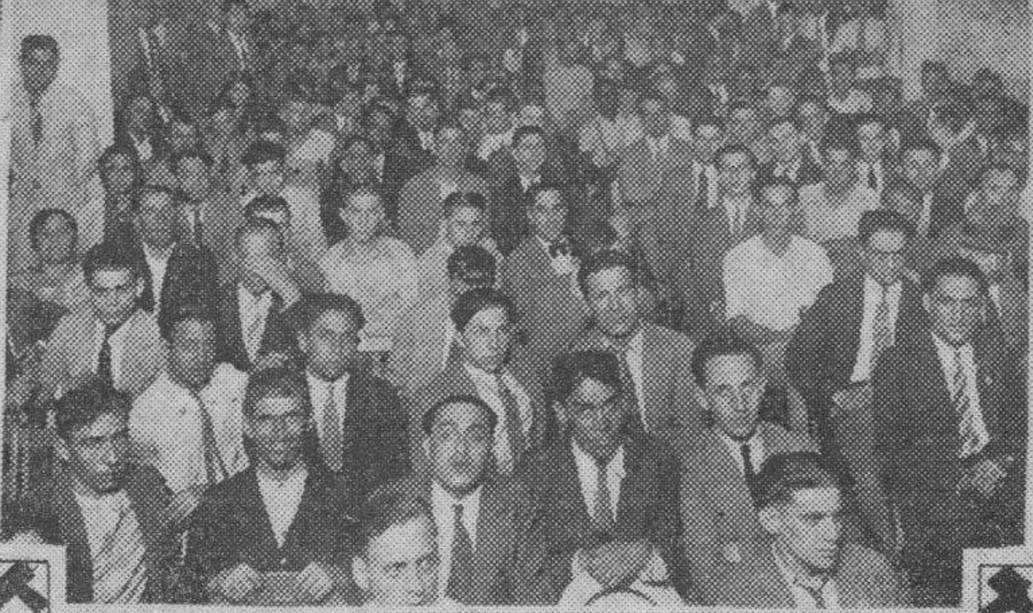
Un aspecto de la numerosa asamblea de desocupados efectuada anoche en el Centro Obrero de Revillagigedo 8, momentos antes de haber sido disuelto por la policía.