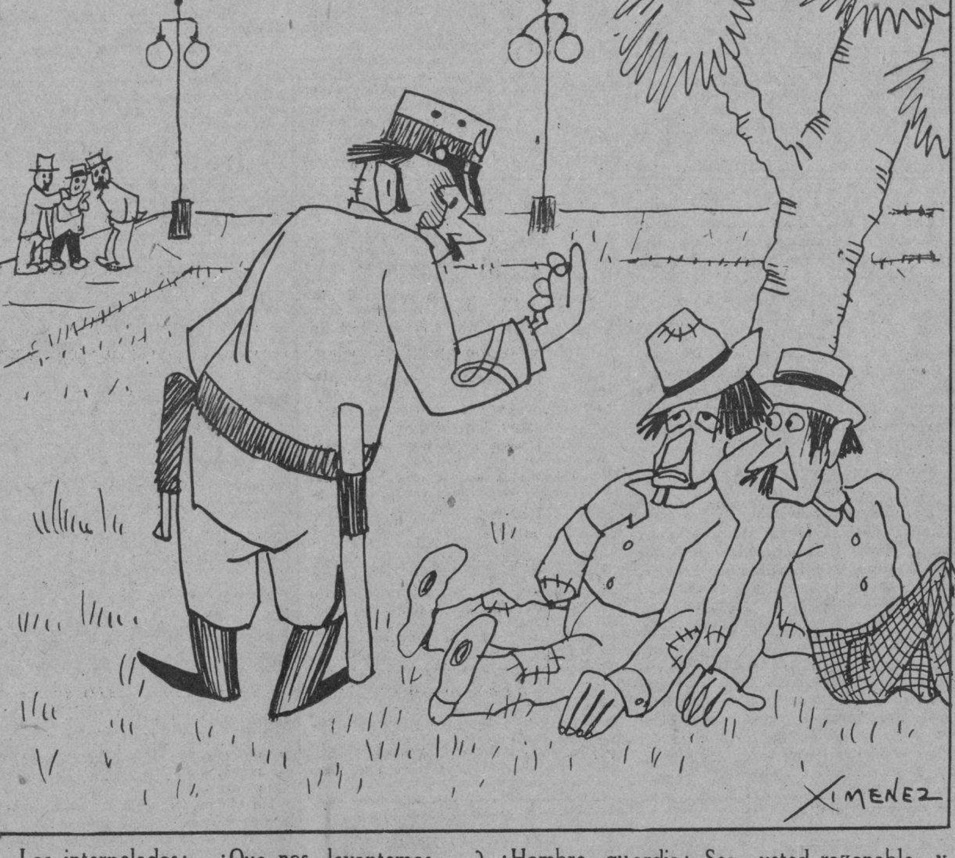
Los interpelados:—¿Que nos levantemos...? ¡Hombre, guardia! Sea usted razonable y traiganos un caldo gallego para poder complacerle.

«Carecen de importancia los esfuerzos de los inconformes.» (Declaraciones del General Machado.)