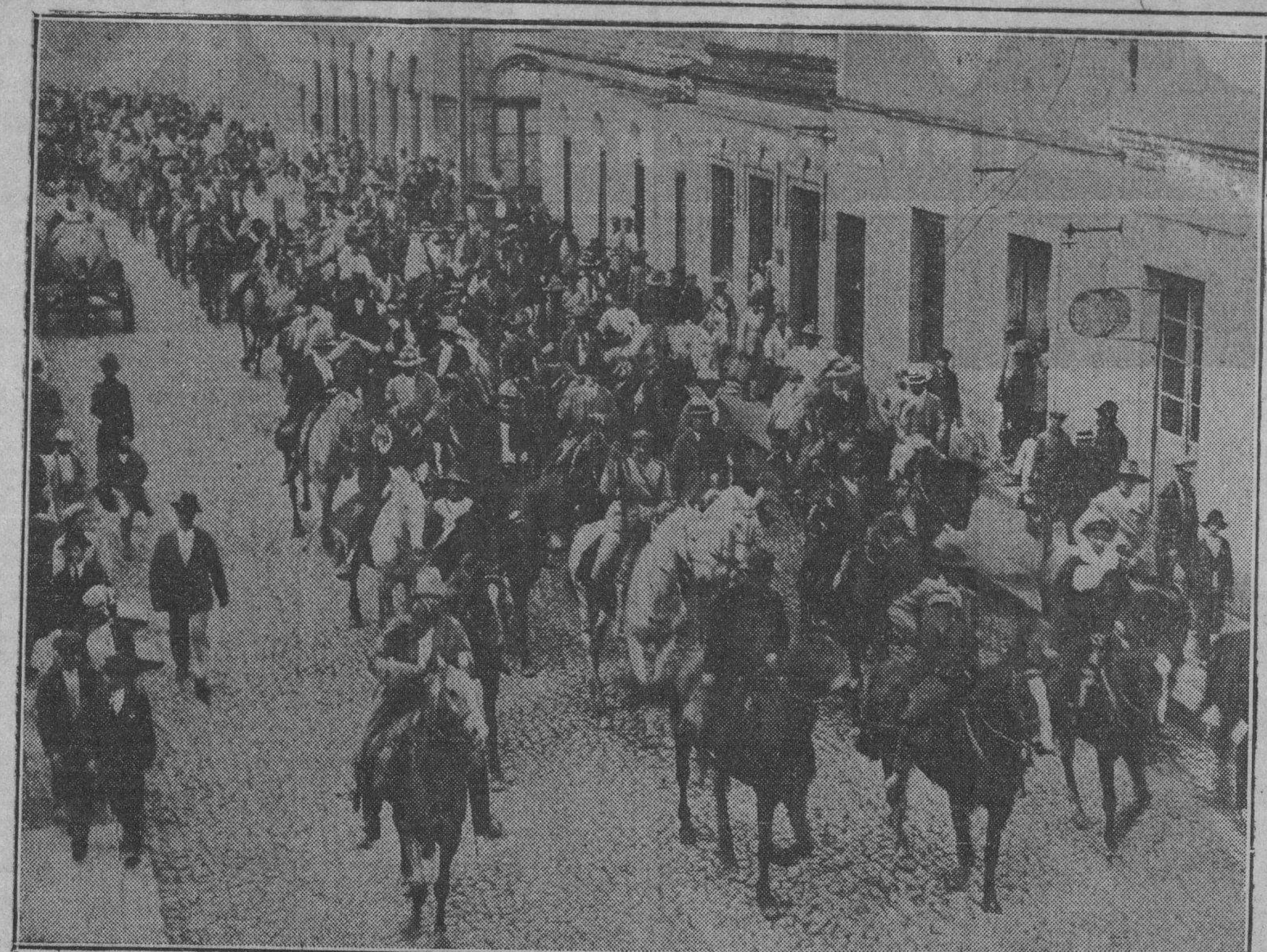
La guerra civil en el Brasil, con frentes de combate en regiones muy distanciadas, ha cautivado la atención del mundo por varias semanas. En esta fotografía, la primera recibida del frente Sur, vemos un grupo de voluntarios organizados por Francisco Flores de Cunha, caudillo revolucionario del Sur.