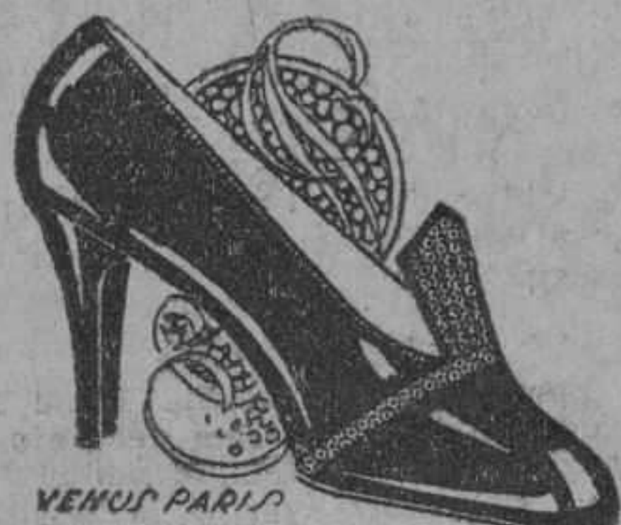
Charol con adornos gris plomo satinado tacón alto y mediano