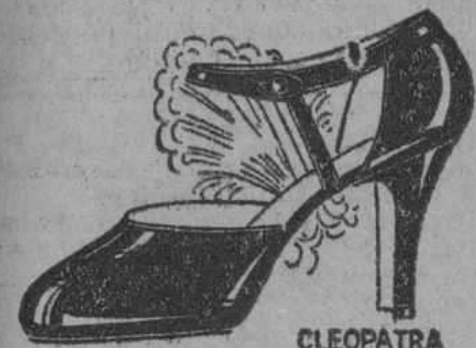
Charol con vivos fresa satinado tacón alto y mediano