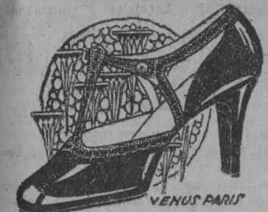
con vistas piel satinada color canela horma corta