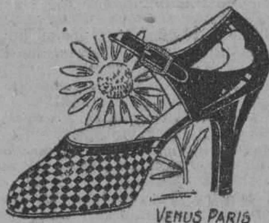
Sandalia para trenzada de charol y satinado oscuro tacón alto

FIDIENDONOS EL CATALOGO • visitando esta casa.