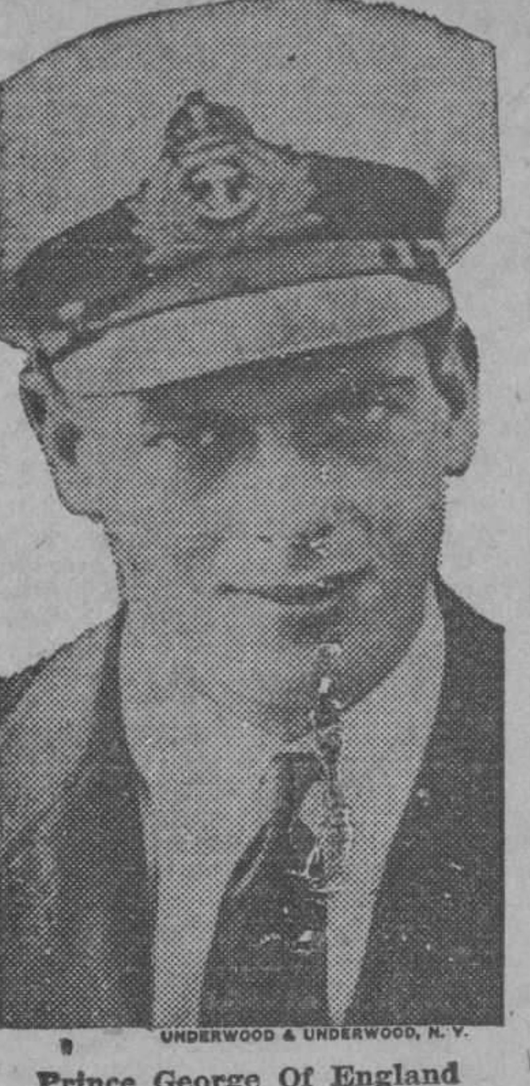
Prince George Of England

Cuando el "Texas" y el "Cuba" estén próximos al puerto de la Habana, saldrá a su encuentro el cañonero "20 de Mayo", con el objeto de agregarse a la escolta que se dará al Almirante de la marina norteamericana que trae el "Texas"