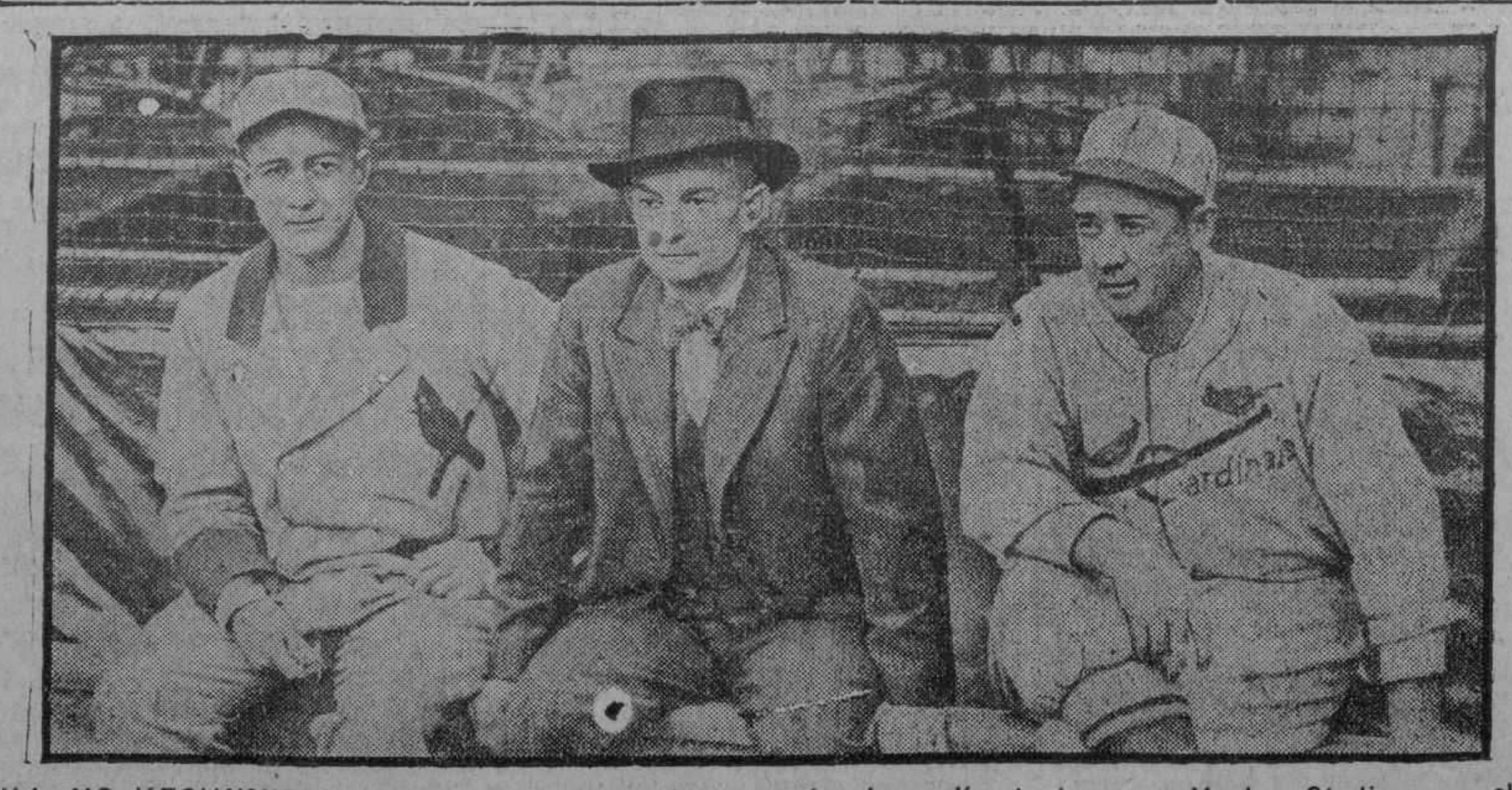
BILL MC KECHNIE ideando su plan de combate en el primer día de juego en Yankee Stadium; es el que se encuentra al centro; el coach Jack Onslow está a la derecha, y el trainer Doc Weaver a la izquierda.