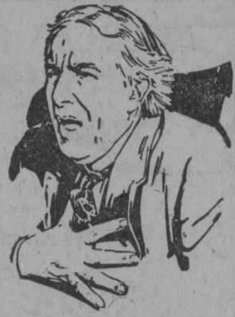
Los constantes espasmos agravan la tos—Librese de ella.

Innumerables investigaciones médico-científicas han demostrado que la tos no se cura sola. Desaparece por breve tiempo y reaparece más grave, irrogiando cada vez más la garganta y los bronquios y pulmones. Es necesario, pues, combatir la tos al primer indicio de ella.