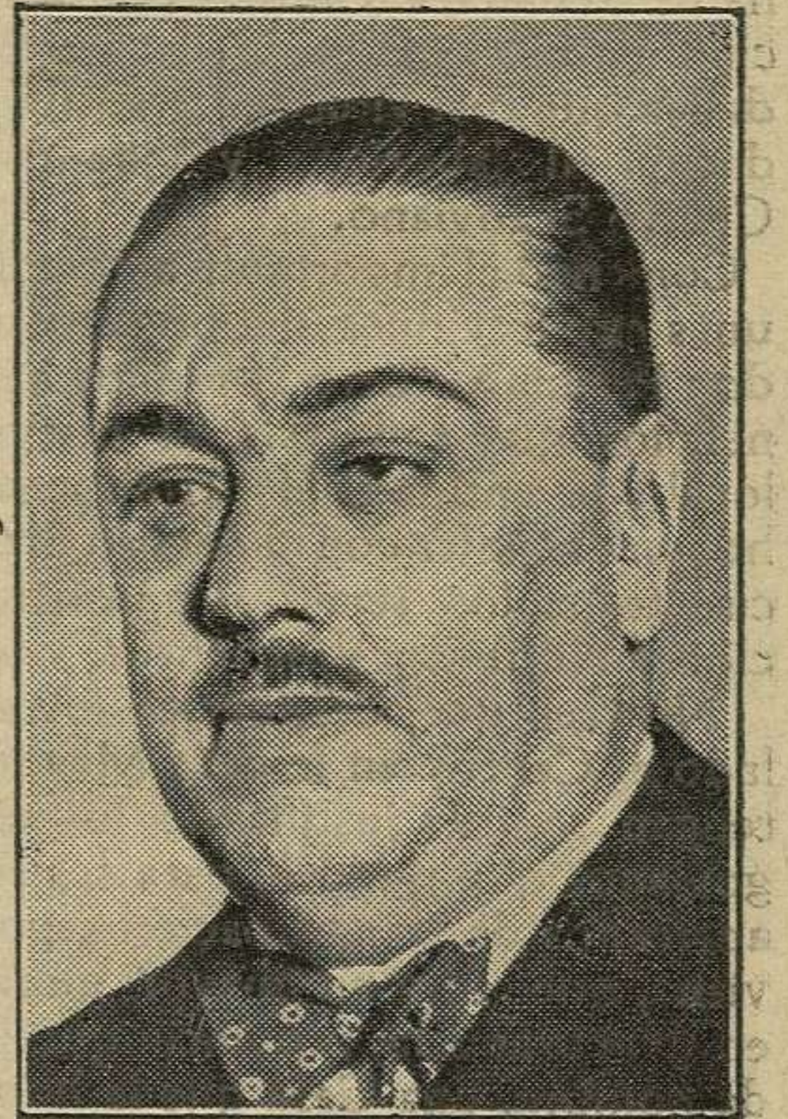
Don Diego Martínez Barrio Elegido presidente de las Cortes

Señor gobernador: En Segovia hay una finca completamente abandonada: El Terminillo.