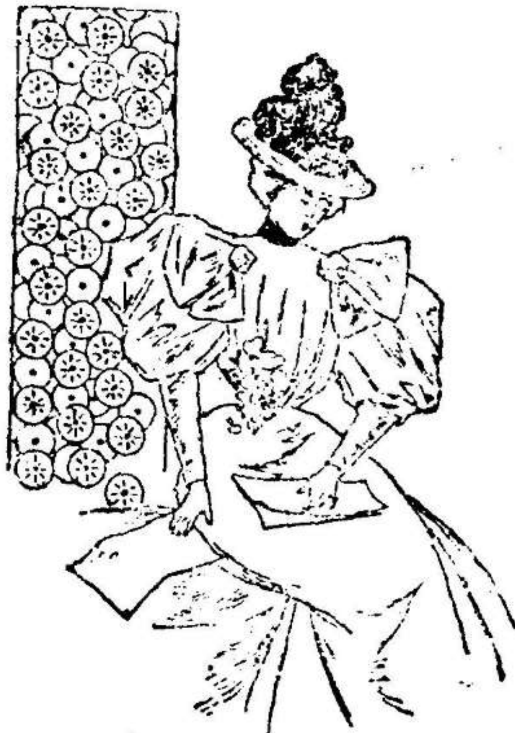
Traje para visita.

Modelo exclusivo para nuestras lectoras, de los Grandes Almacenes de El Siglo, Barcelona. (1)