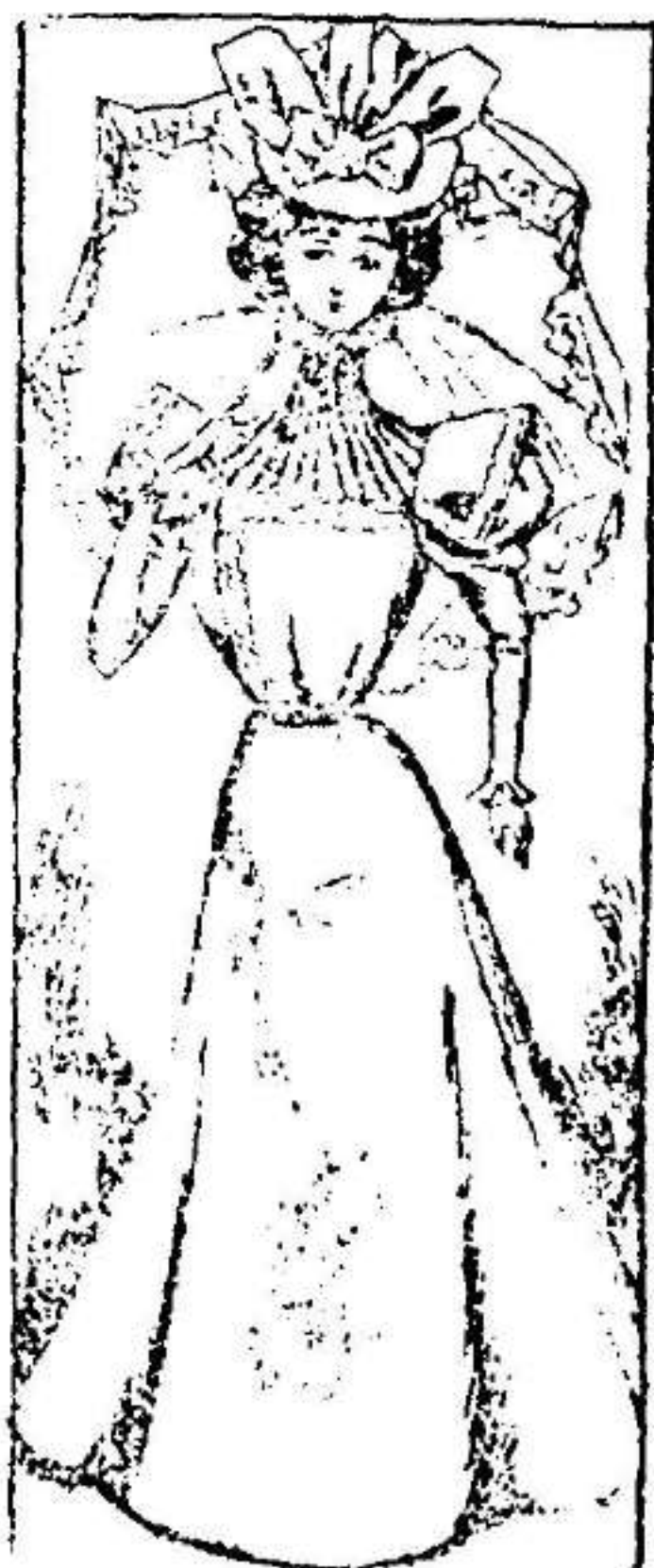
Traje para paseo.

Modelo exclusivo para nuestras lectoras, de los Grandes Almacenes de EL SIGLO, Barcelona.