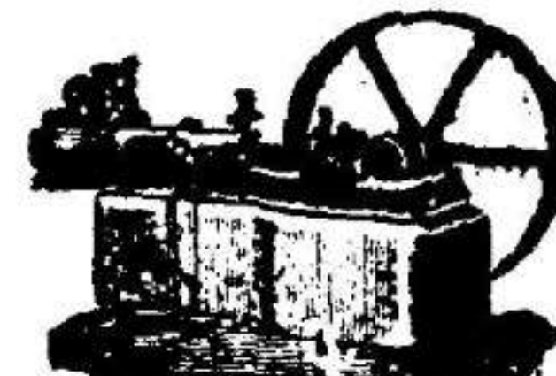
Máquina de vapor horizontal.

Aparatos para hacer gaseosas y toda clase de maquinaria.