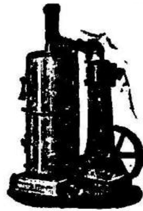
Máquina de vapor vertical.