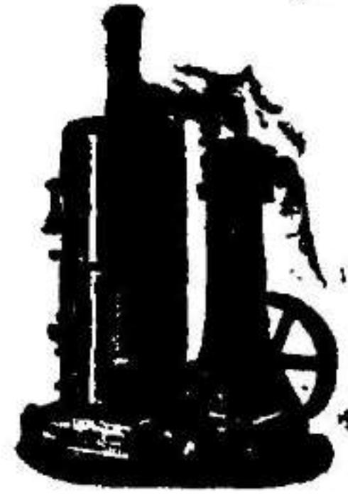
Máquina de vapor vertical.