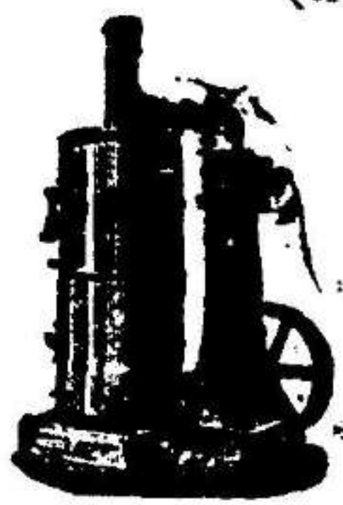
Máquina de vapor vertical.