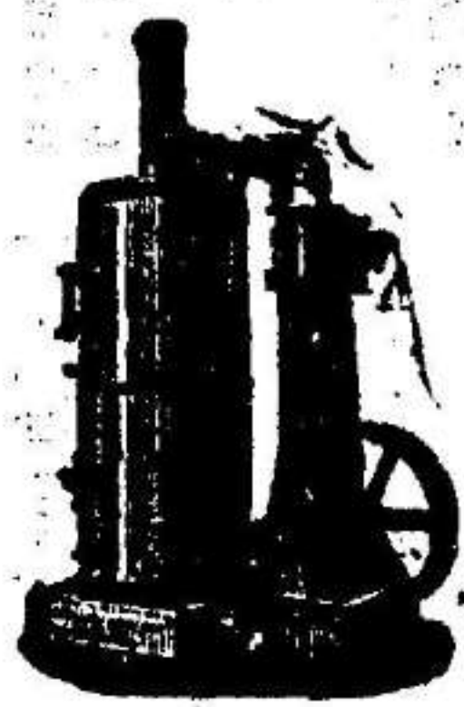
Máquina de vapor vertical.

SUCURSAL EN VALLADOLID Acera de Recoletos, 6