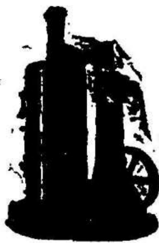
Máquina de vapor vertical.

SUCURSAL EN VALLADOLID Acera de Recoletos, 6