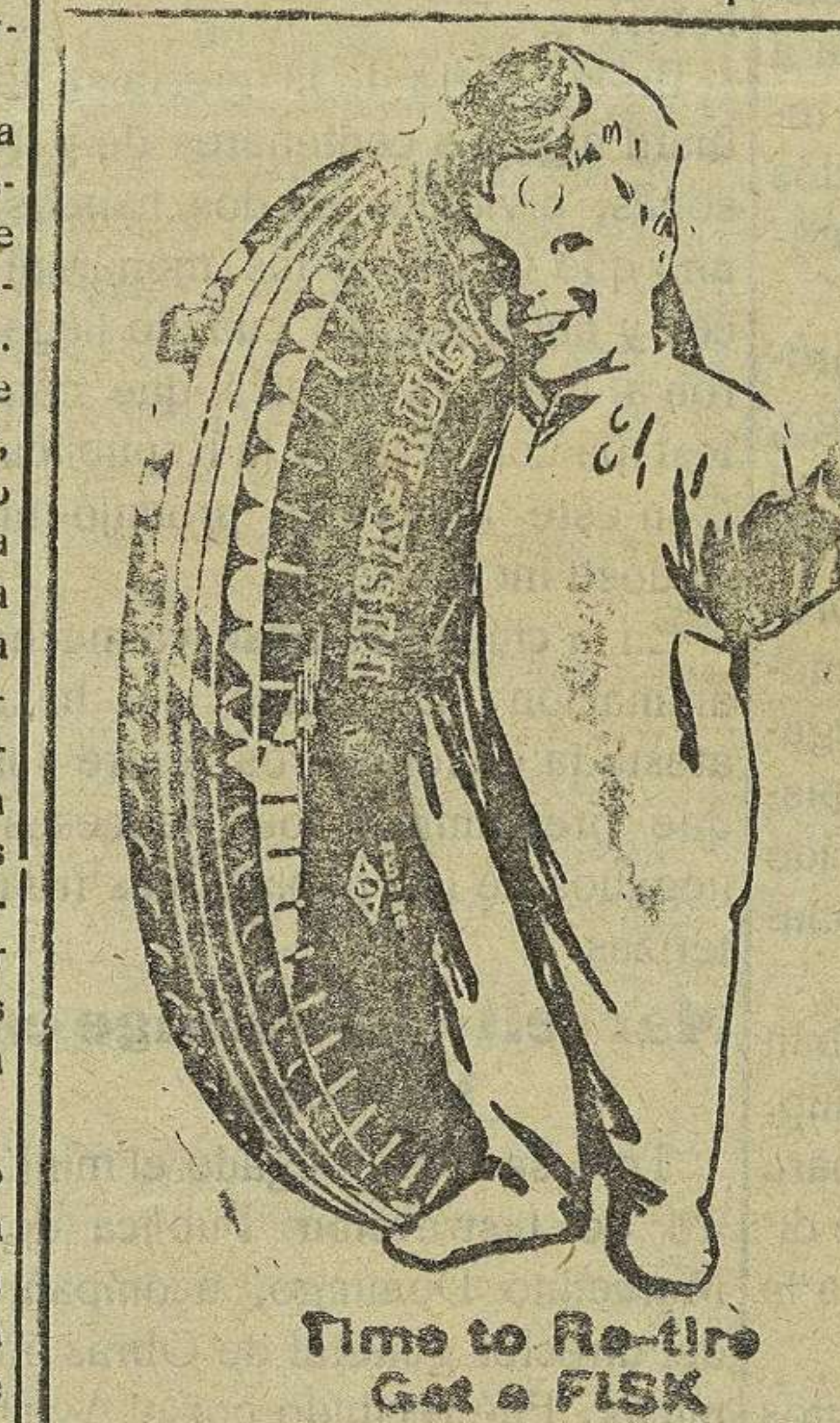
Time to Retire Get a FISK

En una reciente reunión quedó acordado someter dicho señor un proyecto encaminado a que se conceda al par-