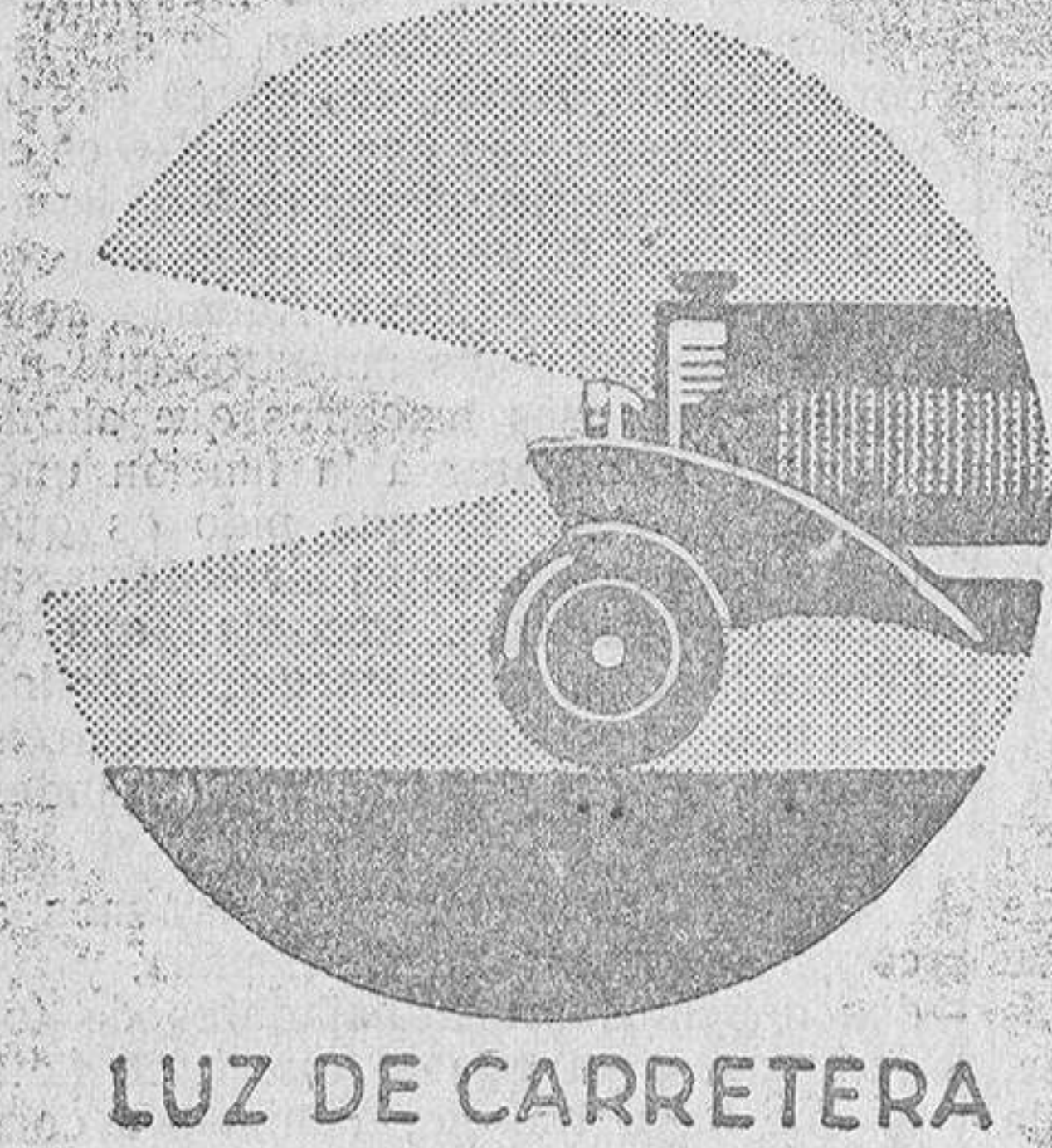
LUZ DE CARRETERA