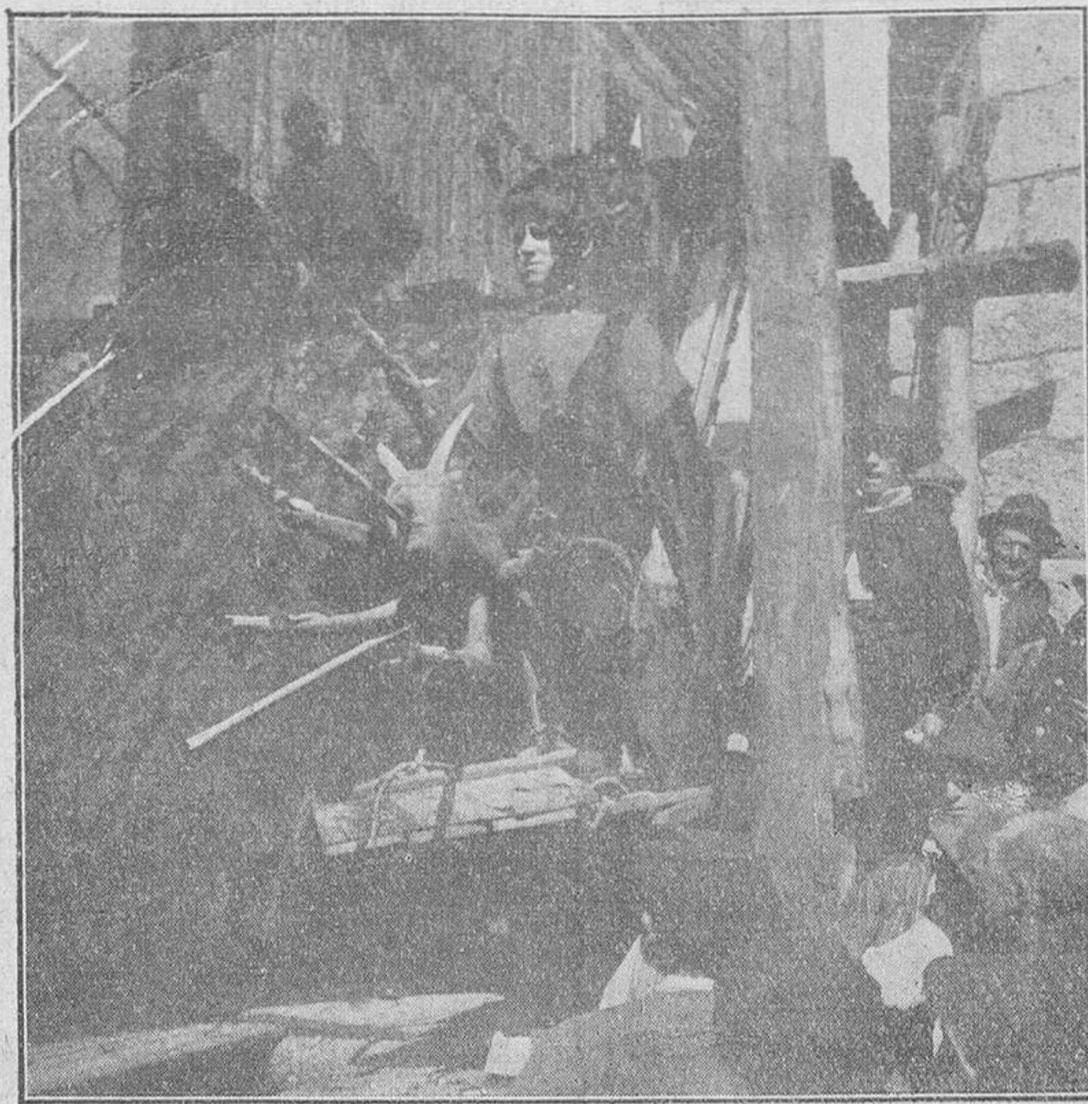
DE LA FIESTA ALBERCANA