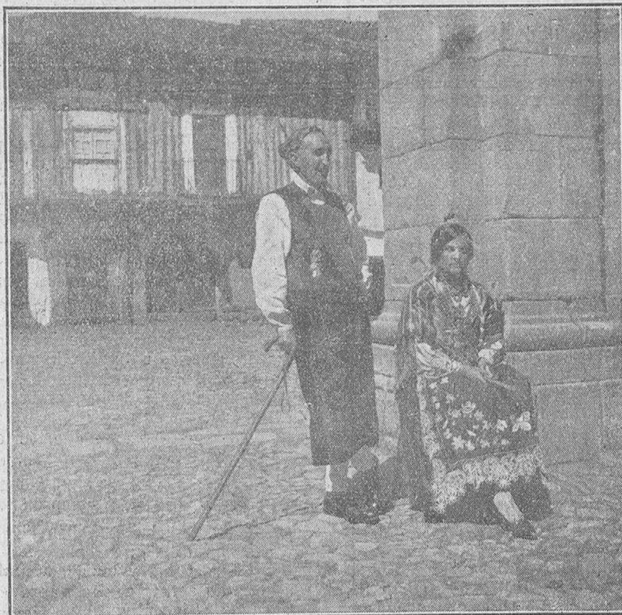
UNA PAREJA ALBERCANA EN LA PLAZA DEL PUEBLO