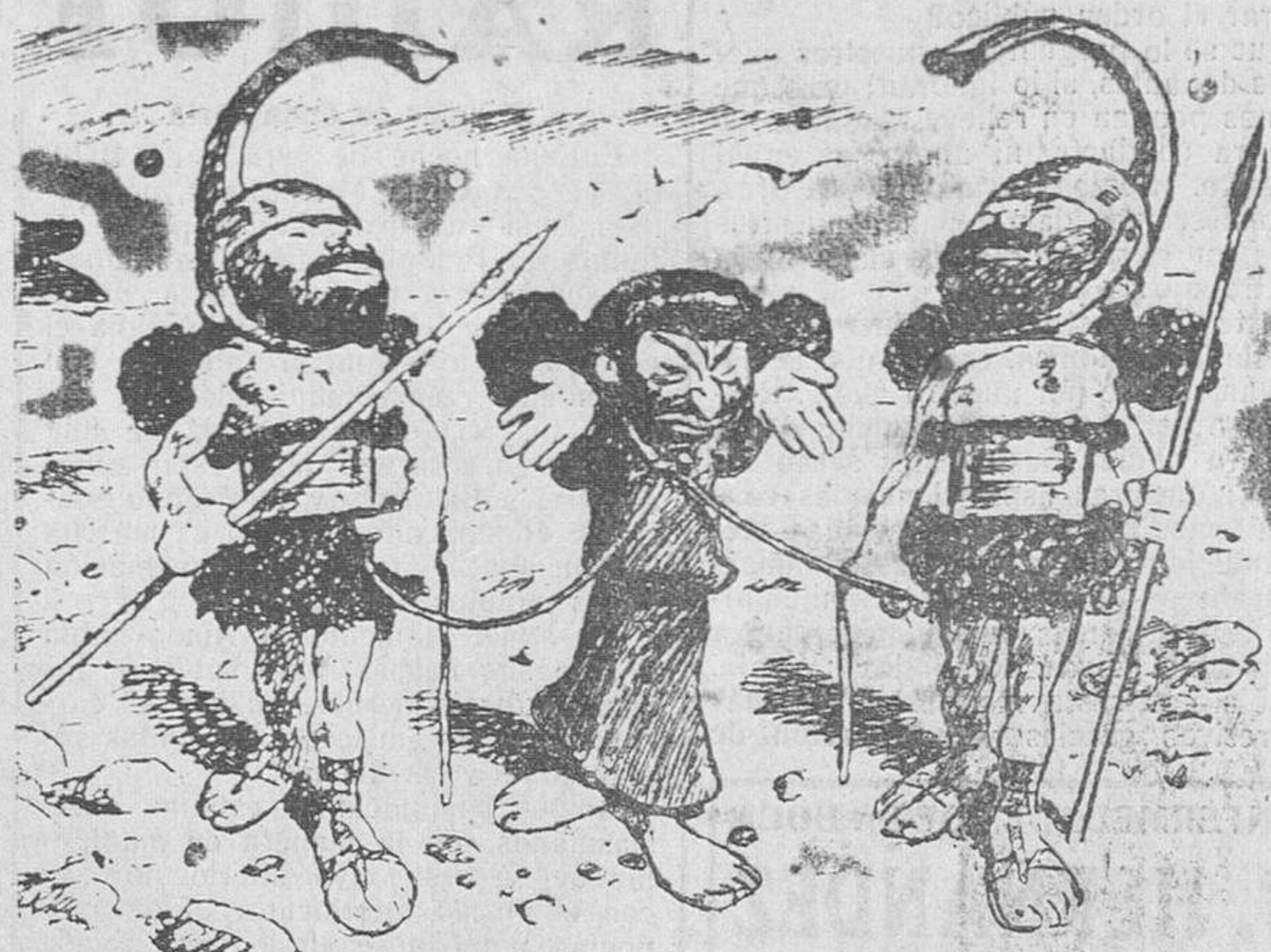
Jonás, conducido para ser juzgado por la primera Sociedad Protectora de los animales.

Hemos encontrado un Estado que, en todos sus órdenes, estaba formado por los que ejercían cargo en beneficio de sus ideales. Diplomacia, ejército, magistratura, profesorado y clero. Todos ellos reparaban las Universidades, dando preferencia para los cargos a los serviles o reaccionarios. Debemos reformar esto, aunque no con espíritu inquisitorial. No hay que creer a nadie enemigo desleal ni indigno en los partidos adversarios. La monarquía no ha dejado nada, pero a sus partidarios no se les puede, aunque sigan siendo virtualmente monárquicos, obligar a abdicar de sus ideales; pero sí lealtad. No ultrajéis la dignidad a esos hombres que, siendo honradamente monárquicos, os servirán mejor que algunos republicanos de nuevo cuño, que vienen a ver lo que da la vaca recién ordeñada. (Grandes aplausos).