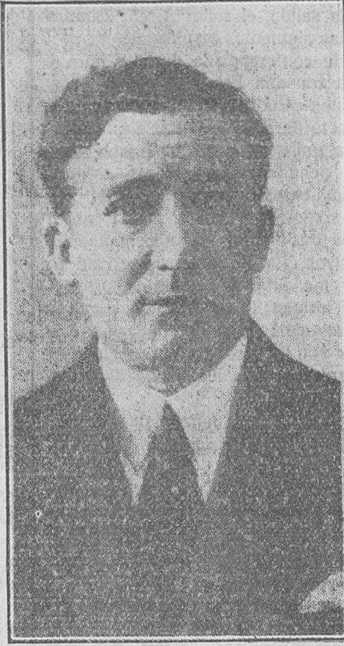
DON JULIO CARABIAS Gobernador del Banco de España