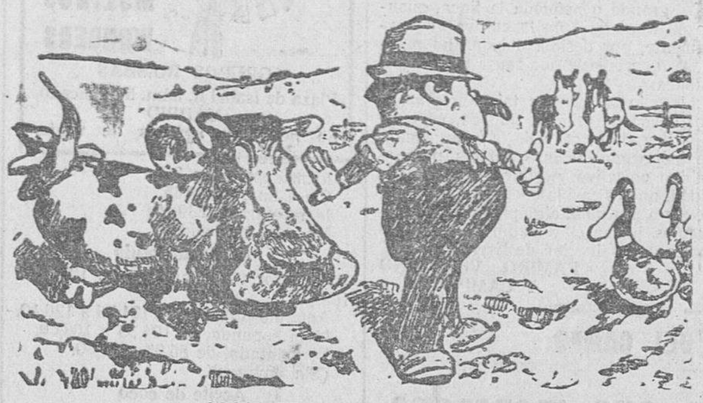
COSAS DE LA VIDA MODERNA El antiguo agente de la circulación urbana se ha hecho agricultor y ganadero.

EL ADELANTO de hoy consta de DIEZ páginas.