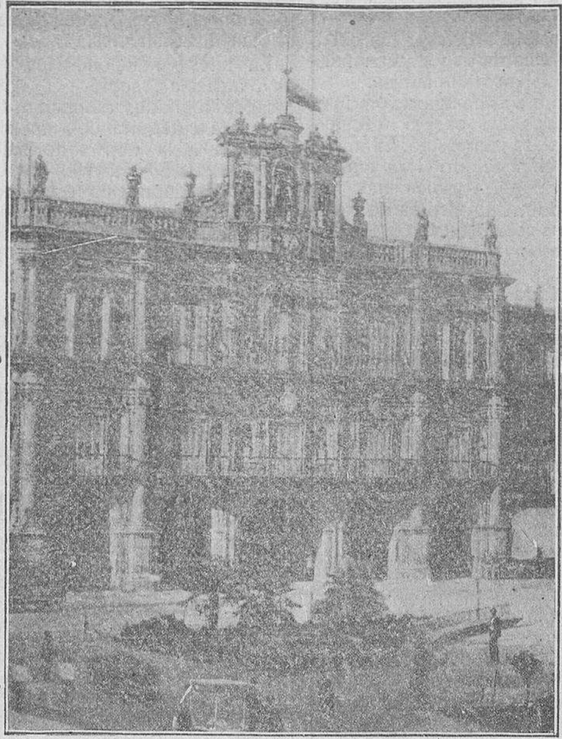
Fachada de la Casa Consistorial, en cuya torreta se coloca tradicionalmente, el día 25 de Julio, la bandera con La Mariseca