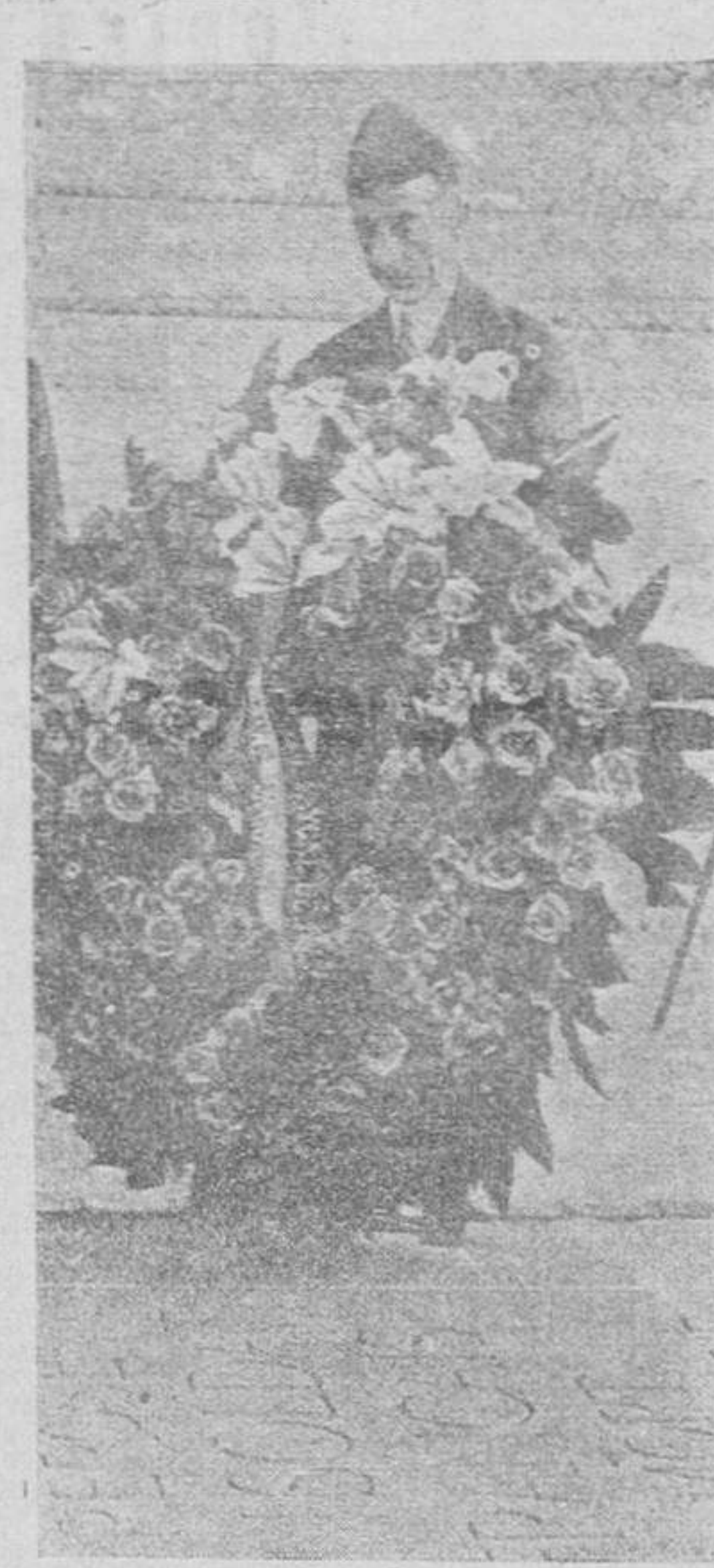
S. M. Faikal I, rey del Irak, que se halla en París, ha depositado una hermosa corona de flores naturales en la tumba del Soldado desconocido.