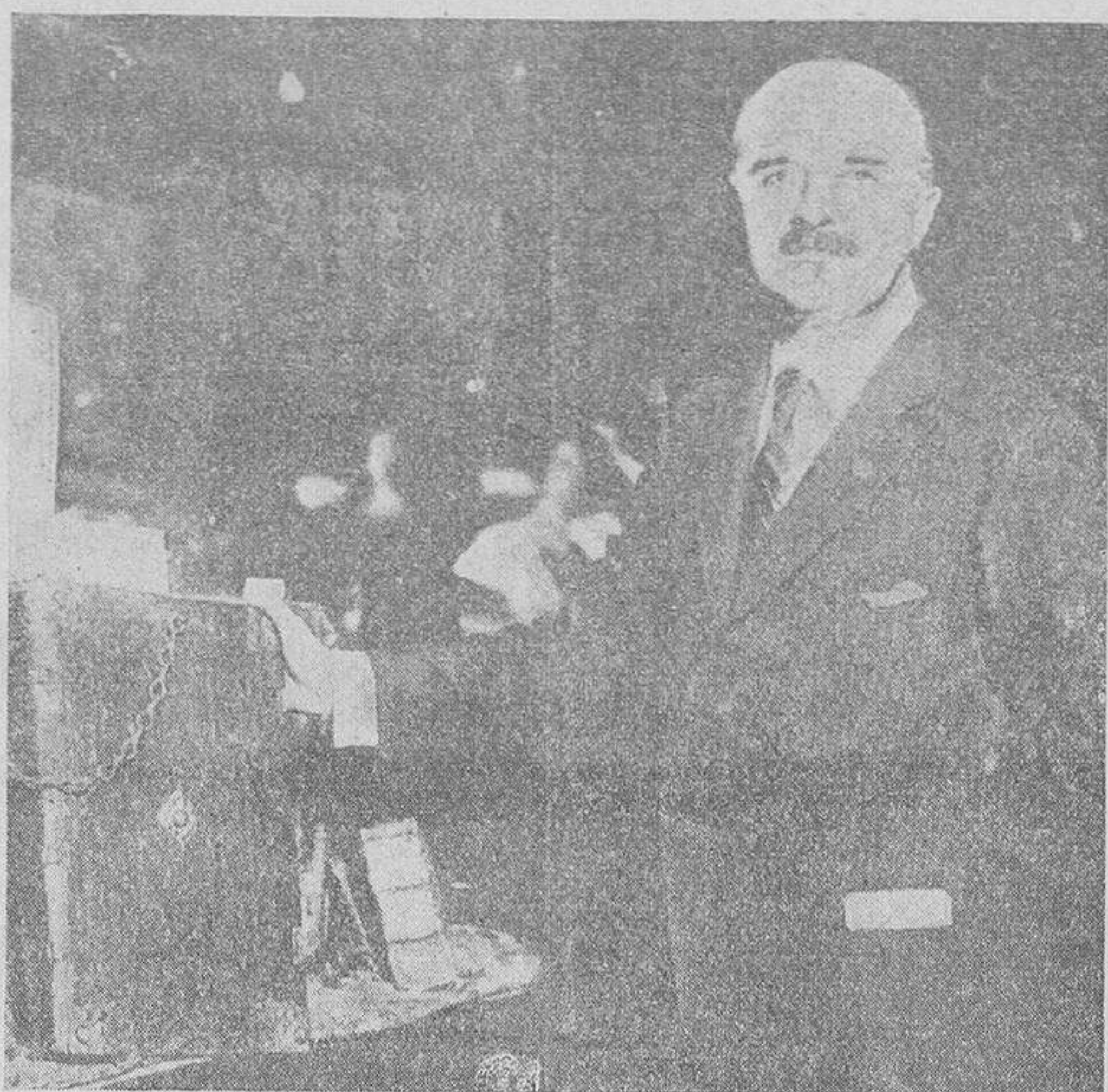
Un magnífico ejemplar de una de las Biblias impresas por Gutenberg, que ha sido comprada al Monasterio de San Pablo, cercano a Viena, en la bonita suma de cuarenta millones de francos, por el coleccionista americano doctor Vallberg. Dicho ejemplar, impreso en pergamino, es el que mejor se conserva en la actualidad.