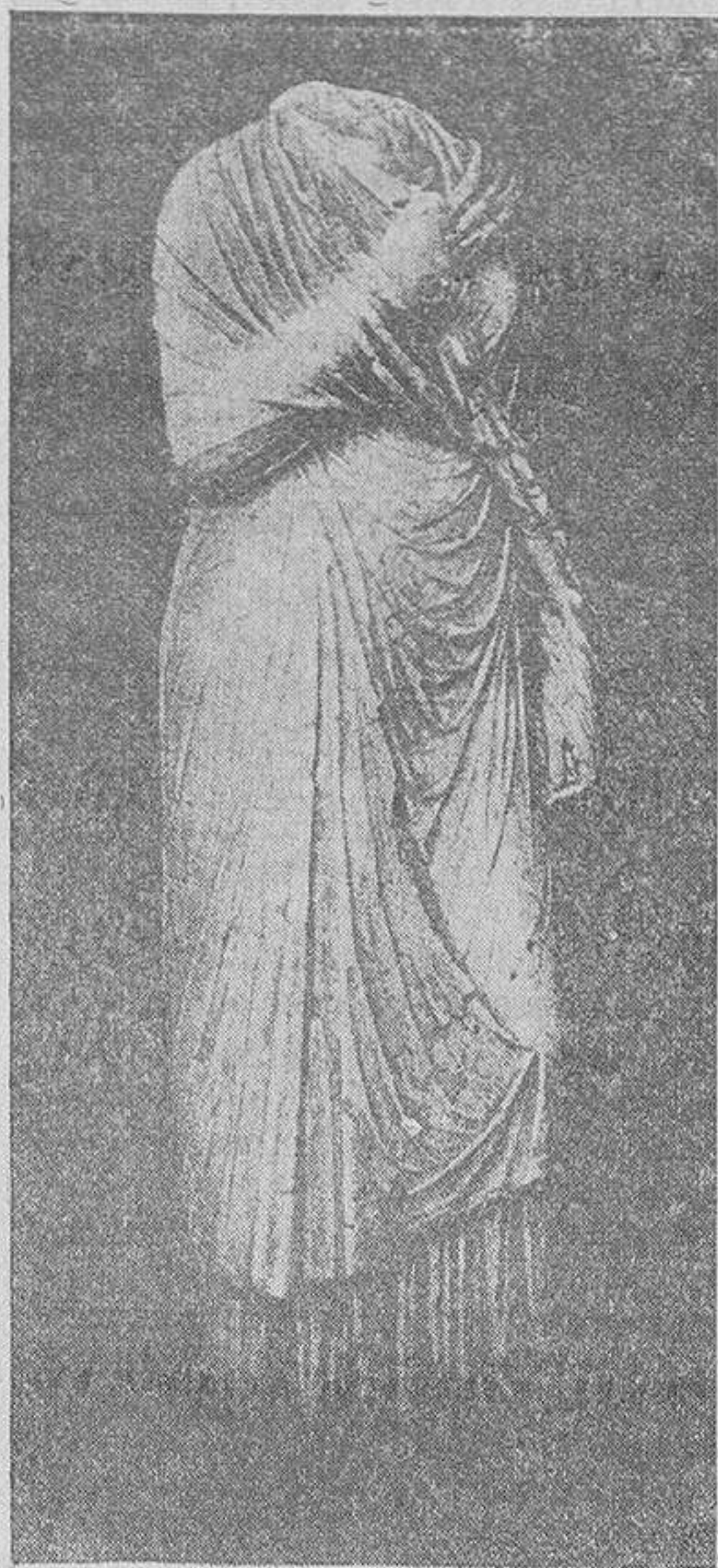
Una de las bellas esculturas halladas en las excavaciones de la Necrópolis romana descubierta en Carmona.