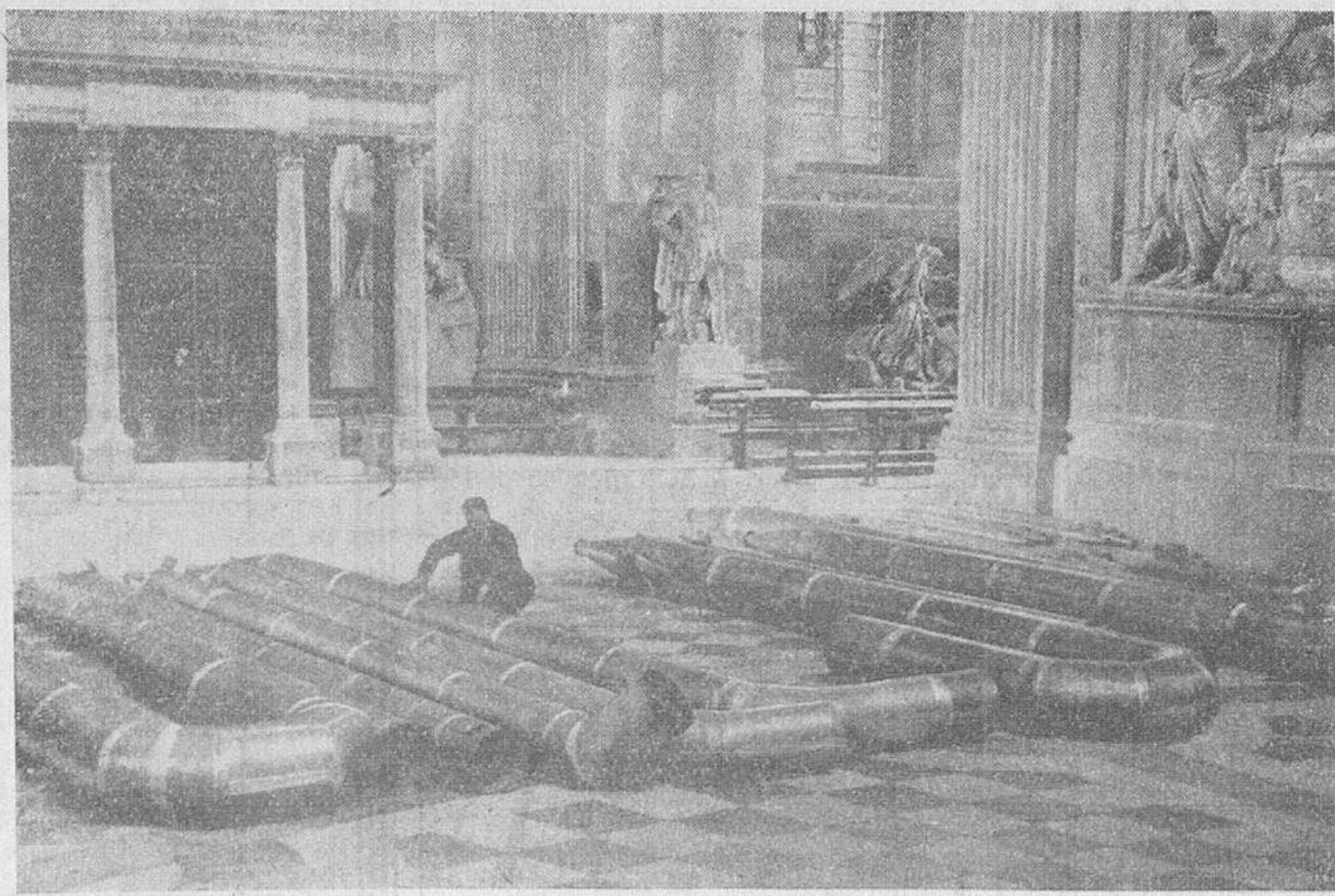
Los gigantes tubos del órgano que será colocado en la Catedral de San Pablo, en Londres.