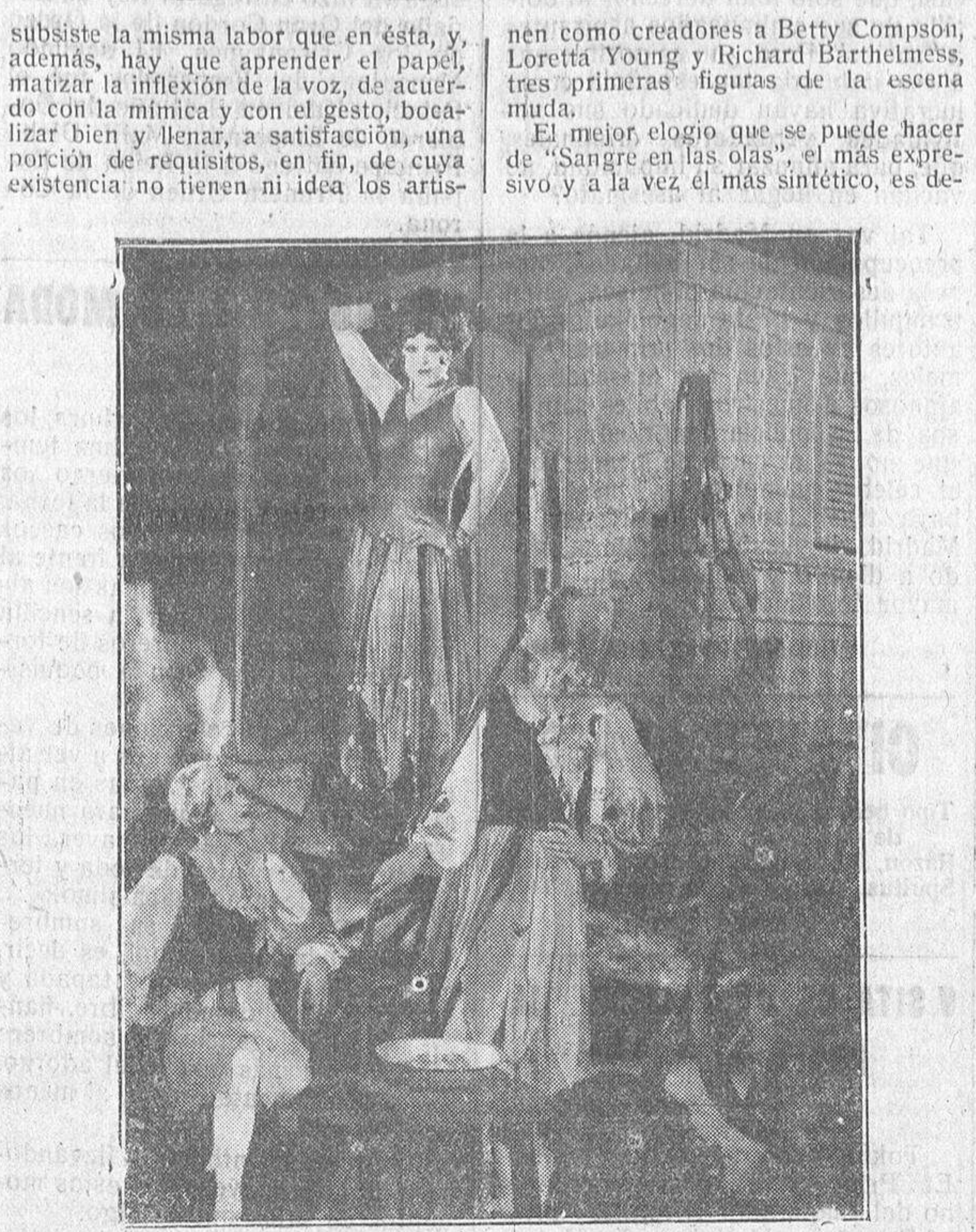
Una escena de la gran super-producción "Serenata".

PROPIETARIO EUSTAQUIO DOMINGUEZ VALLADOLID