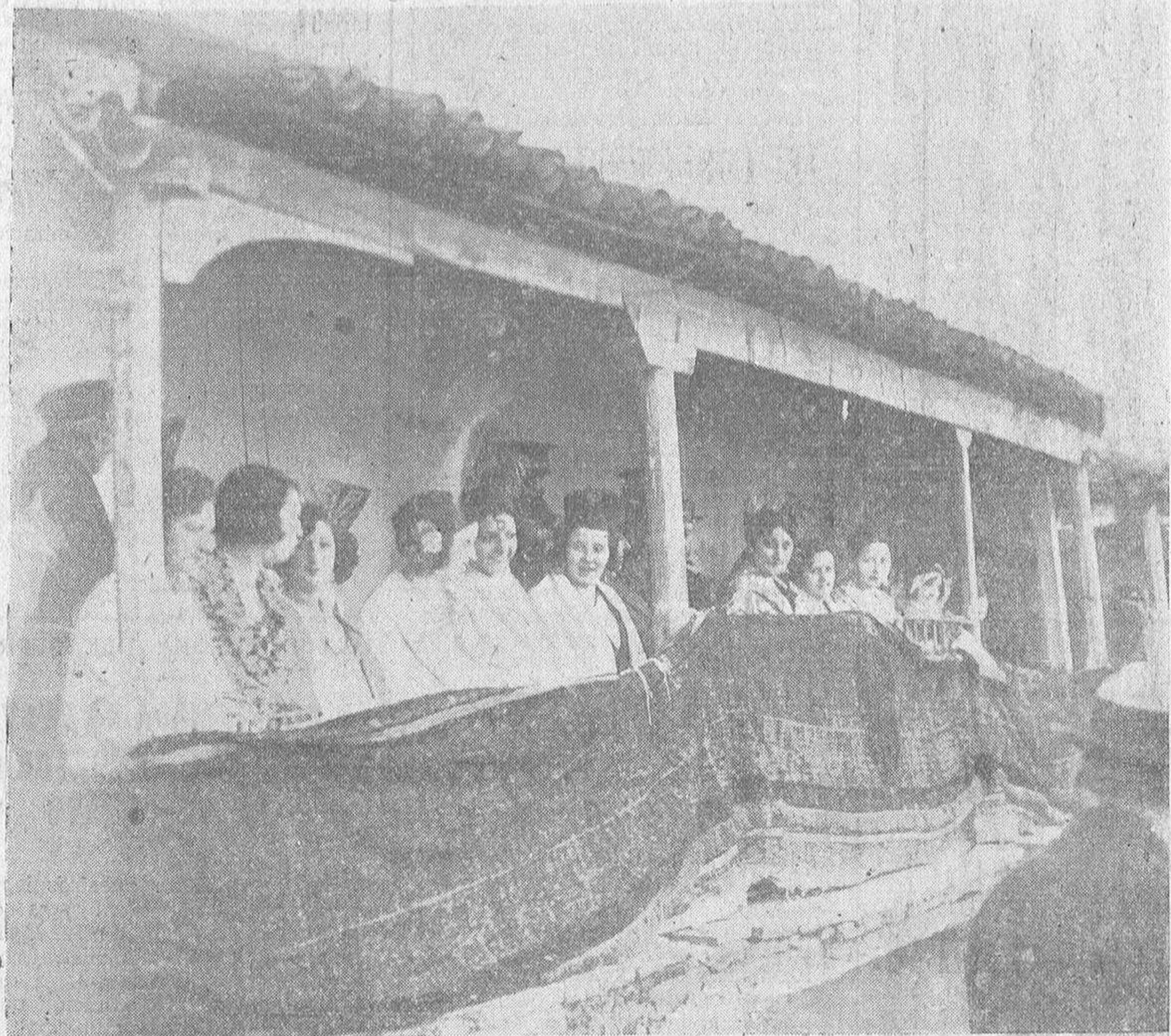
Primavera en invierno! El palco presidencial que ocuparon las bellísimas señoritas presidentas, para las que la glacial temperatura puso más de relieve sus encantos.