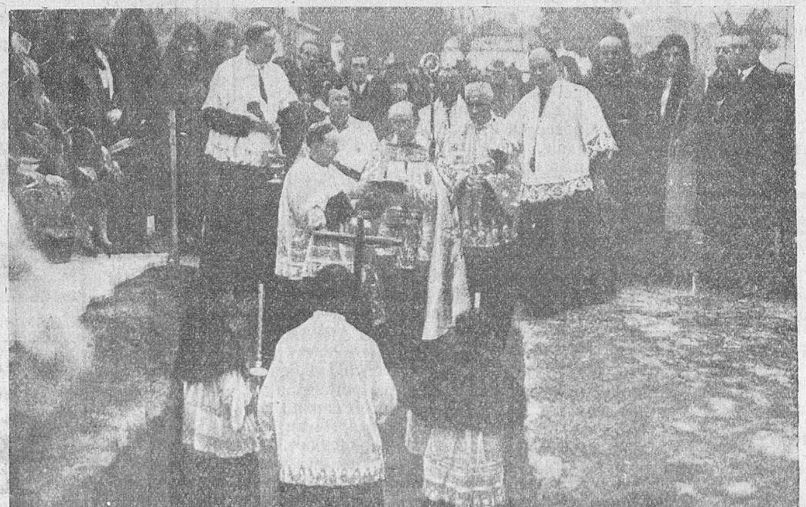
El Cardenal Arzobispo de Sevilla, monseñor Ilundain, bendiciendo los terrenos en los que se levantará la nueva Casa de las Religiosas Adoratrices