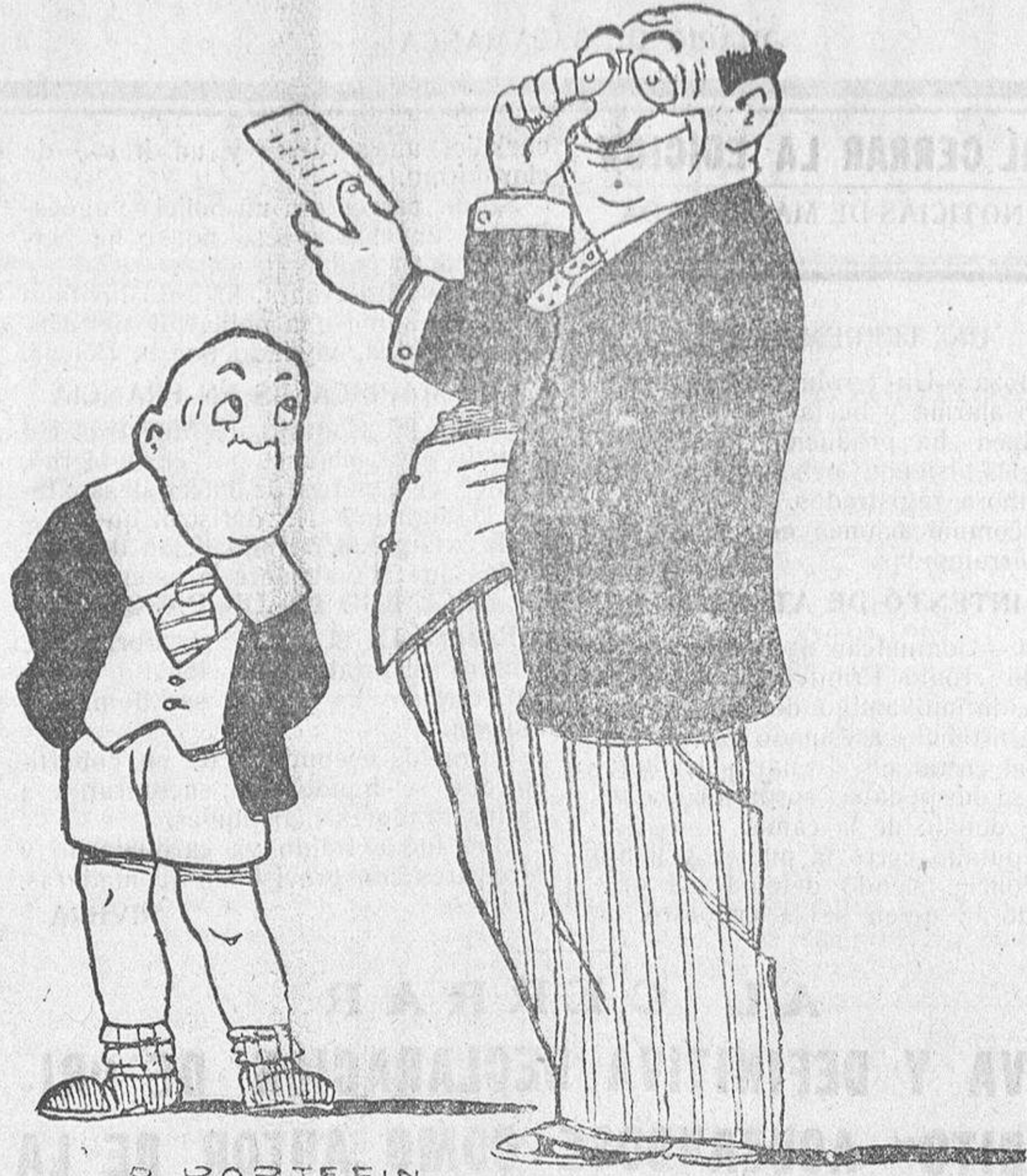
LA VIDA CARA

SE NECESITA, una persona para guardar una extensión de terreno de veinte hectáreas, en el término de Carbajosa de la Sagrada, que sepa el oficio de herrero para labrar las rejas y herrar los bueyes del dueño de la finca.