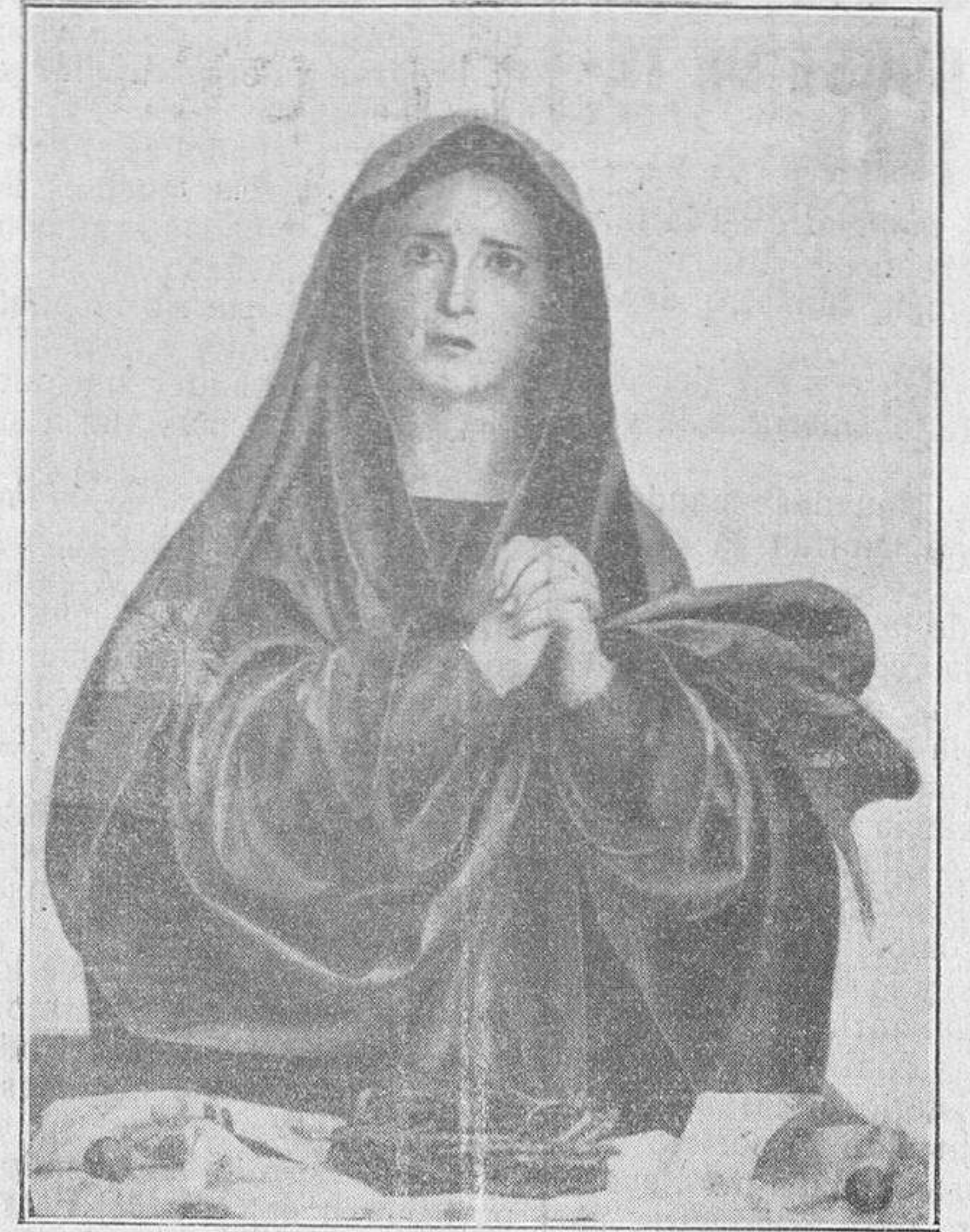
Imagen de la Soledad, que se encuentra en el camerino del Sepulcro de Santa Teresa, de gran valor artístico, donada por el primer Duque de Alba

—¿Nuestros proyectos? Cualquiera que conozca las necesidades, se da cuenta del problema. A mi juicio no hay más que una solución, que el Ayuntamiento se dispone a realizar. La primordial, la más imperiosa, es la estación. La distancia es la ruina del co-