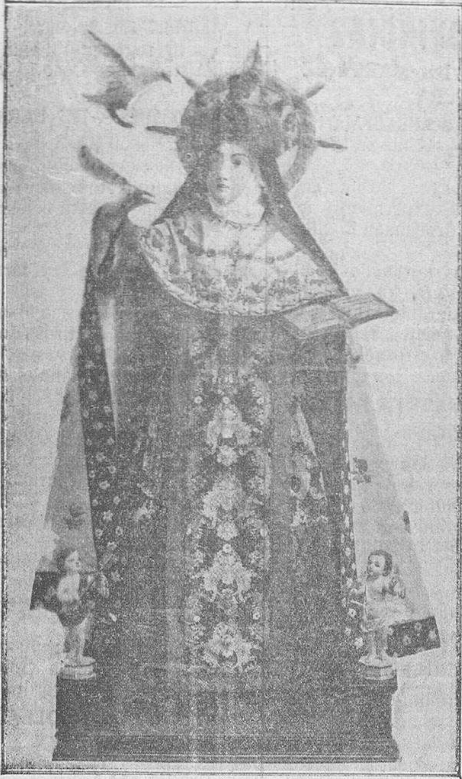
Imagen de Santa Teresa de Jesús