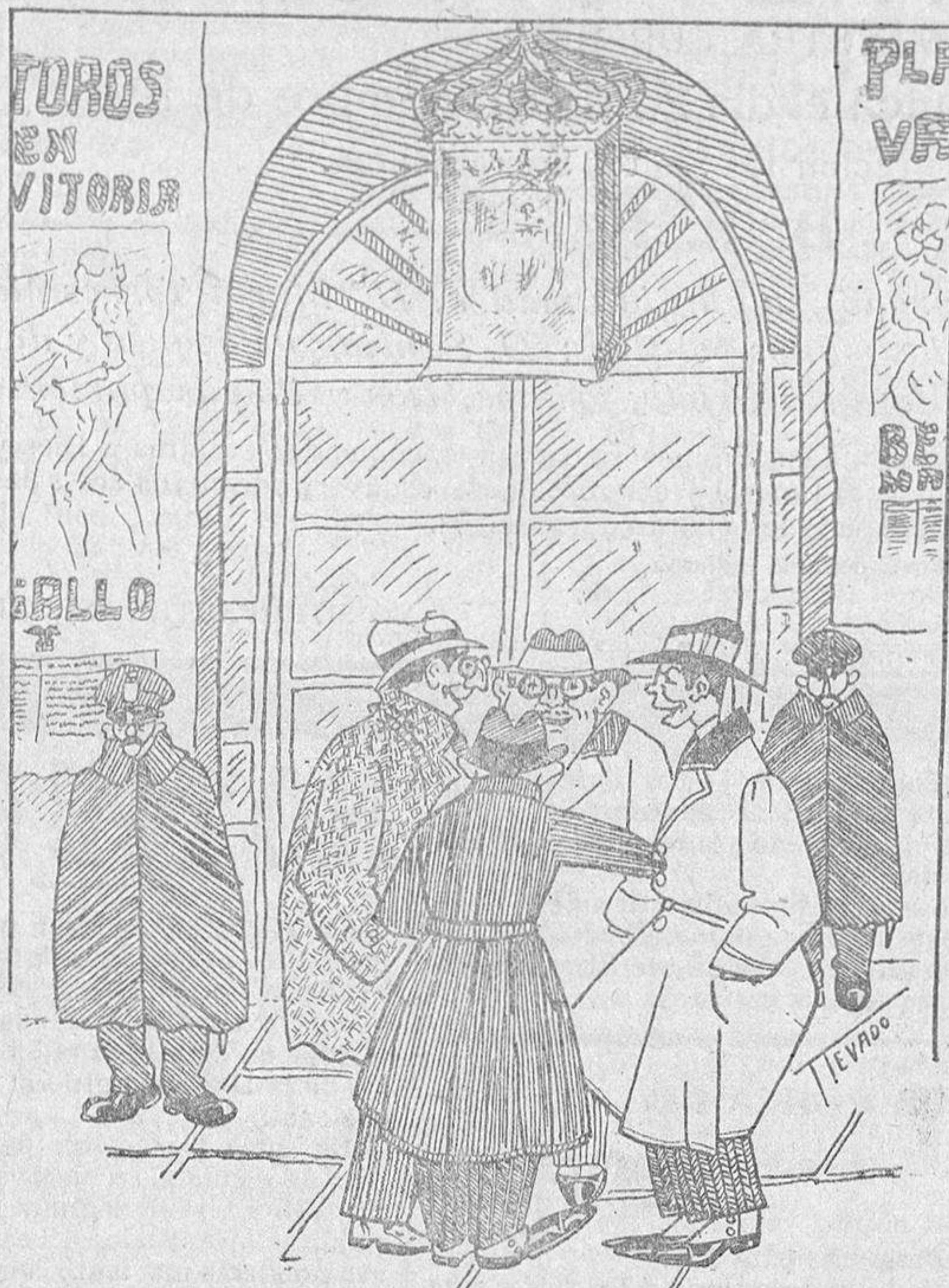
SALIDA DE LA SESION Los periodistas: ¿Hay nota, don Equis? —Sí, interesantísima, hemos tratado un asunto de «primera necesidad». —La baja del pan. —No, señores; la instalación de otro evacuatorio.

Ante tan importantes ventajas, la Federación Católica-Agraria Salmantina, al igual que sus hermanas las demás Federaciones castellanas en sus respectivas provincias, no ha dudado en promover, de acuerdo con los entusiastas y competentes Ingenieros de la División Hidráulica del Duero, un acto de propaganda para la constitución de la Confederación Sindical Hidrográfica de la cuenca de dicho río, acto que tendrá lugar en esta ciudad el domingo, 28 del corriente mes, en el teatro Bretón, a las once de la mañana, y en el que tomarán parte ilustres Ingenieros, cerrando el acto con el broche de oro de su elocuentísima voz nuestro excelentísimo Prelado, que una vez más quiere demostrar con ello que al lado de los intereses espirituales de sus hijos, le preocupan muy mucho el pro-