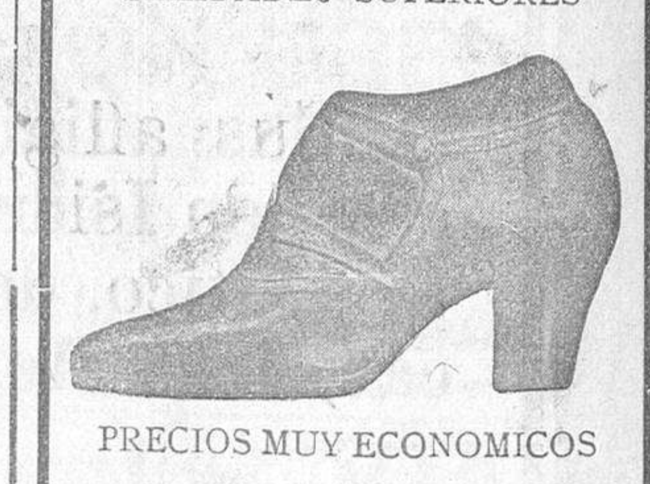
PRECIOS MUY ECONOMICOS