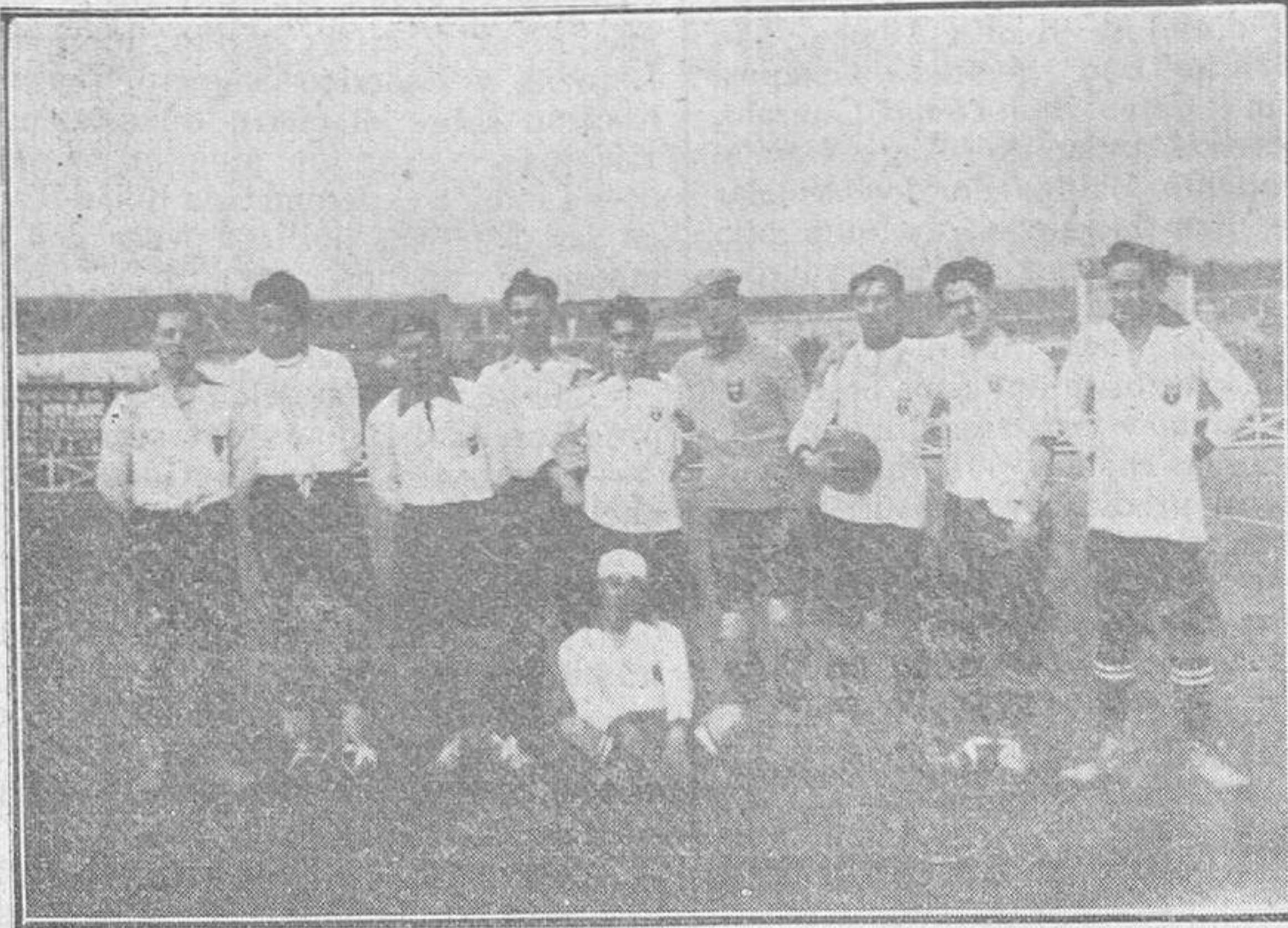
Stadium Salmantino Luises.

—Nada. Ibamos con ciega confianza en el triunfo. —¿El árbitro? —Pérez García. Por cierto que hizo un excelente arbitraje muy imparcial, sabiendo llevar dignamente el peso de un tan formidable partido como era. —¿C mo linearon los equipos?