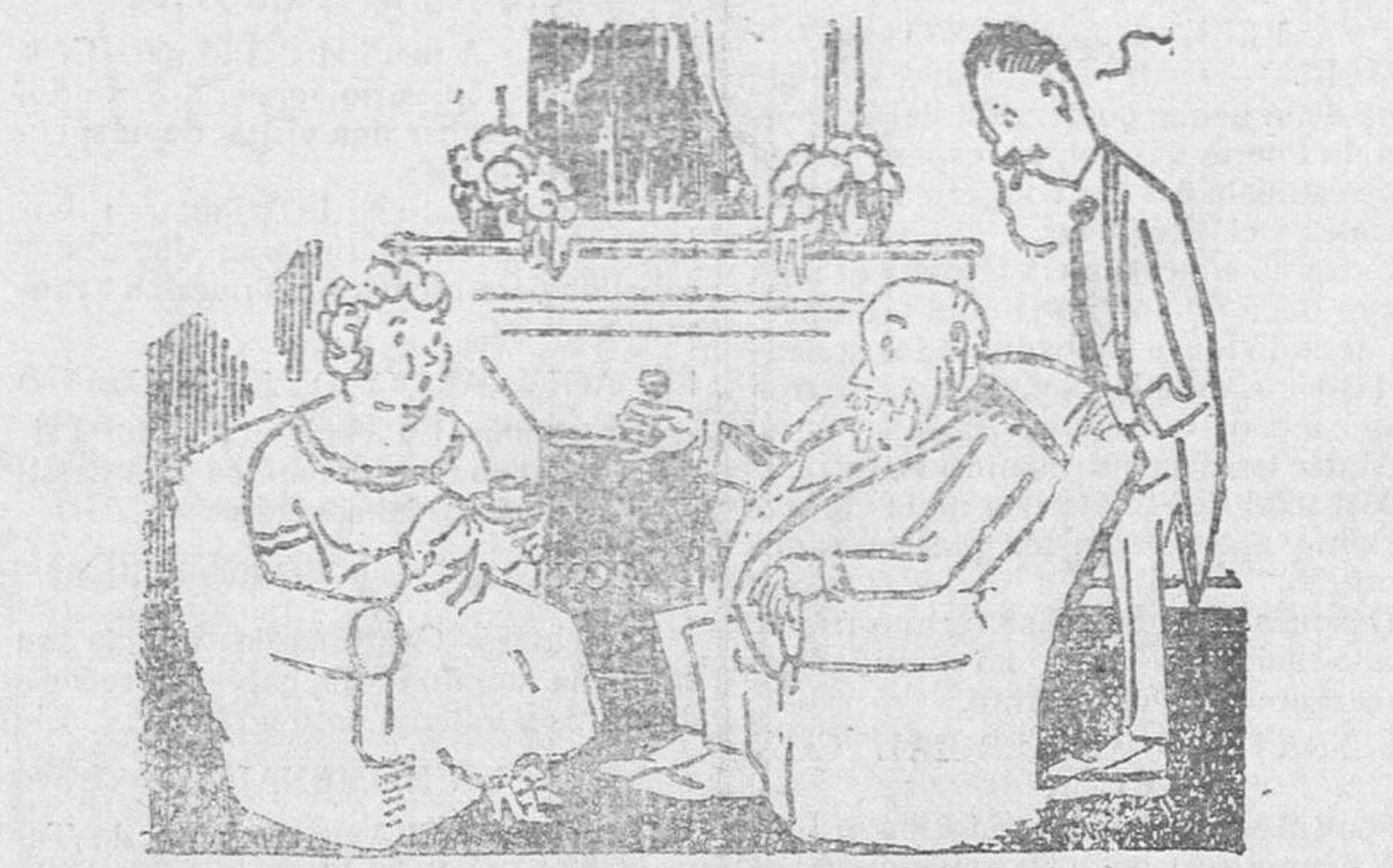
—¡Otra joven que ha matado a su hermana enferma! —¡Qué muchachas las de hoy! ¡En mis tiempos eso lo hacían los médicos!