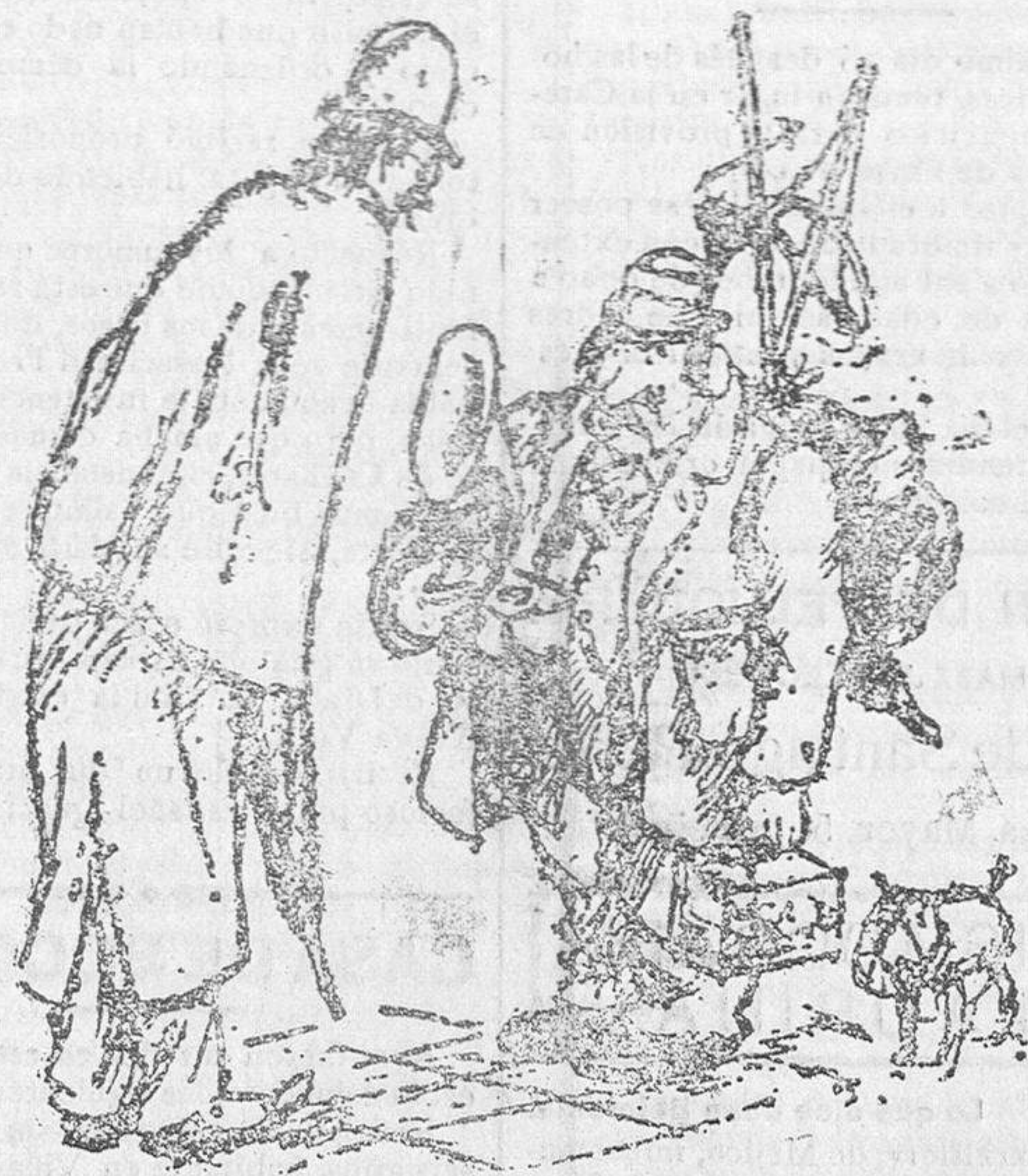
—¿Dónde va usted con el fonógrafo, el aparato de telefonía sin hilos y el canario? —A ver si encuentro una casa tranquila.