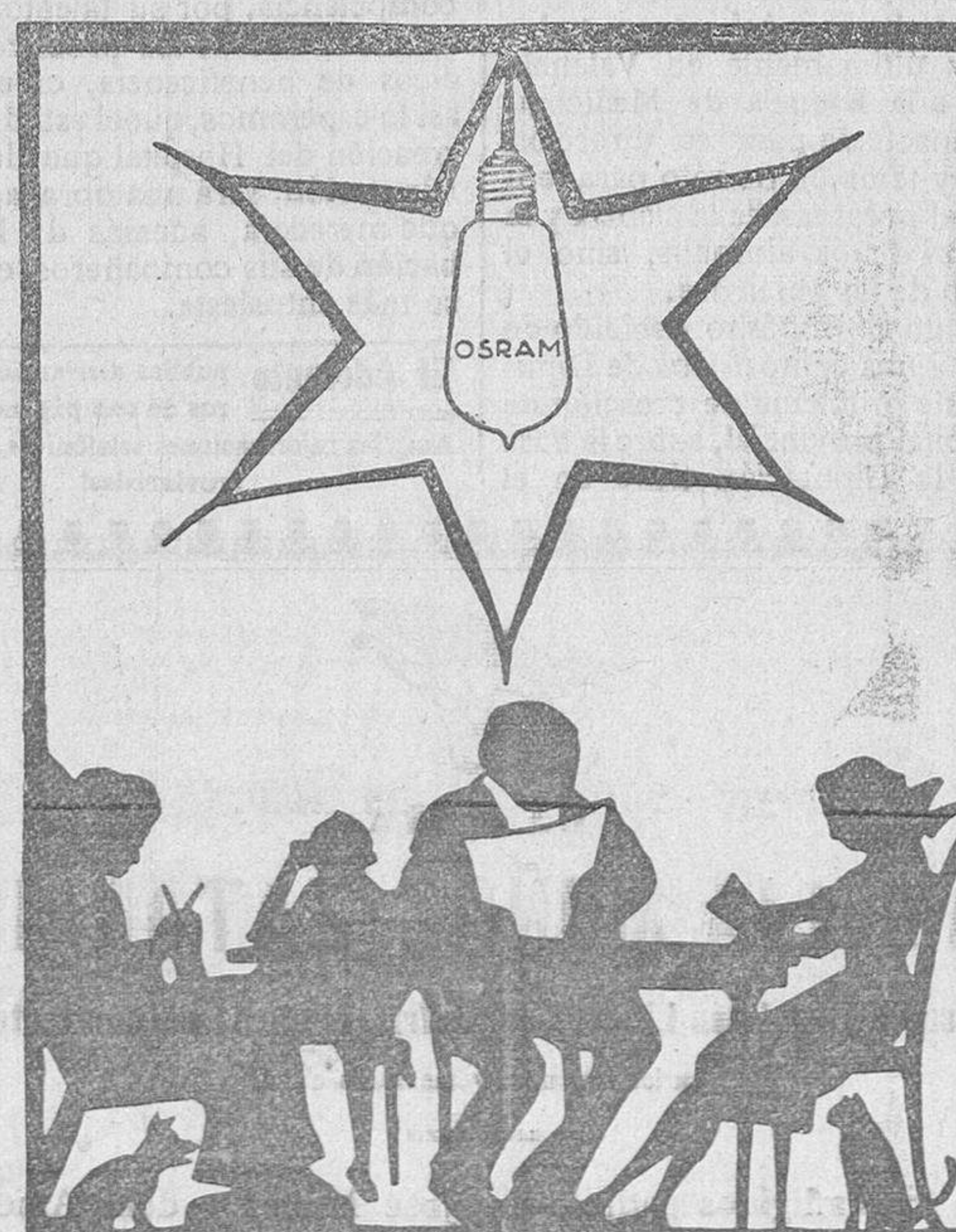
No se hagan más de rogar, solo la lámpara Osram es la alegría del hogar.

El Adelanto es el diario de más circulación de la provincia. Redacción, Ramos del Manzano, 42. Salamanca