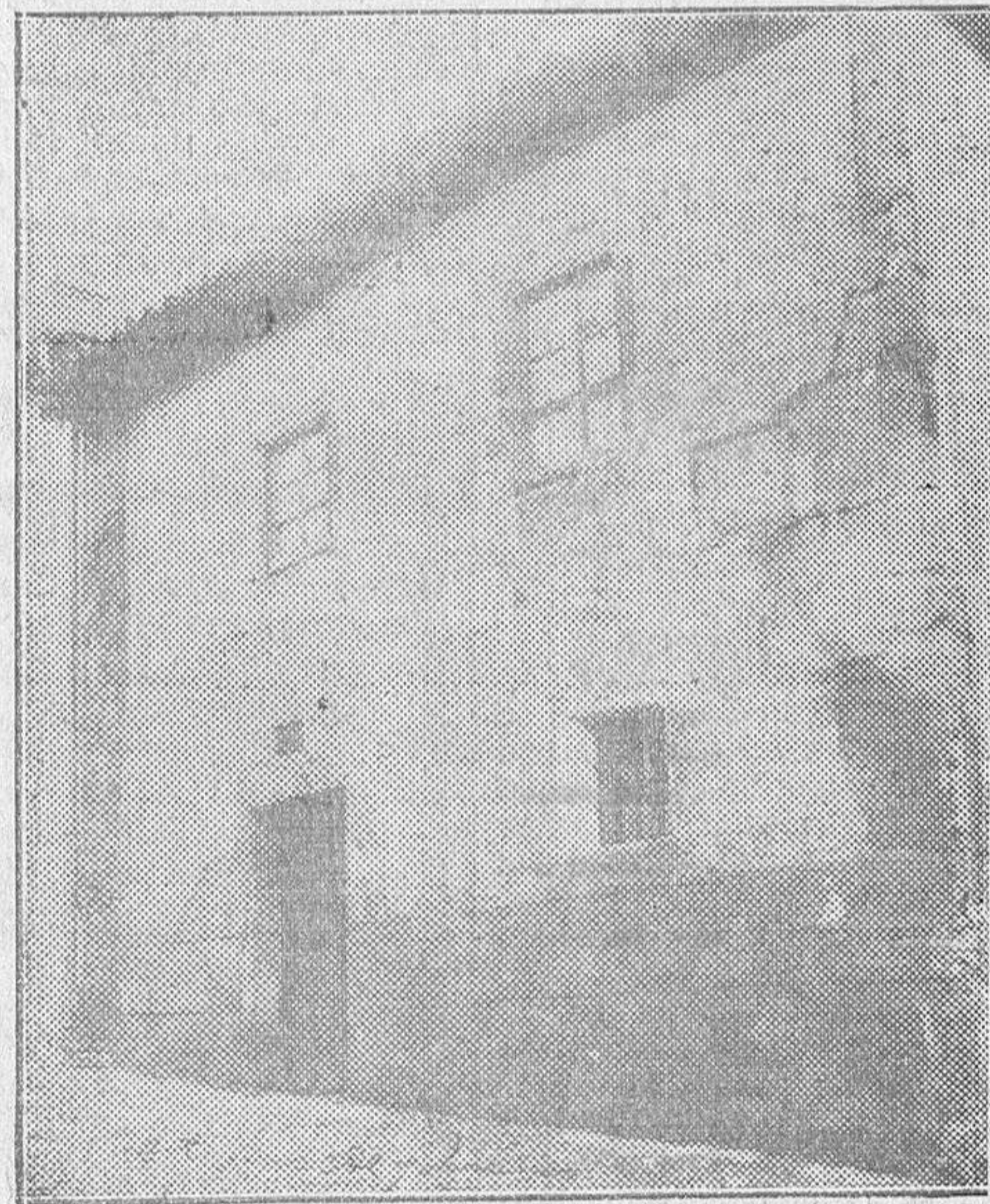
Casa donde nació el glorioso maestro Bretón.

La calle donde está enclavada la casa, se llamó de la Alegría. La obra de Bretón, realizada a fuerza de amarguras, como su vida misma, no se