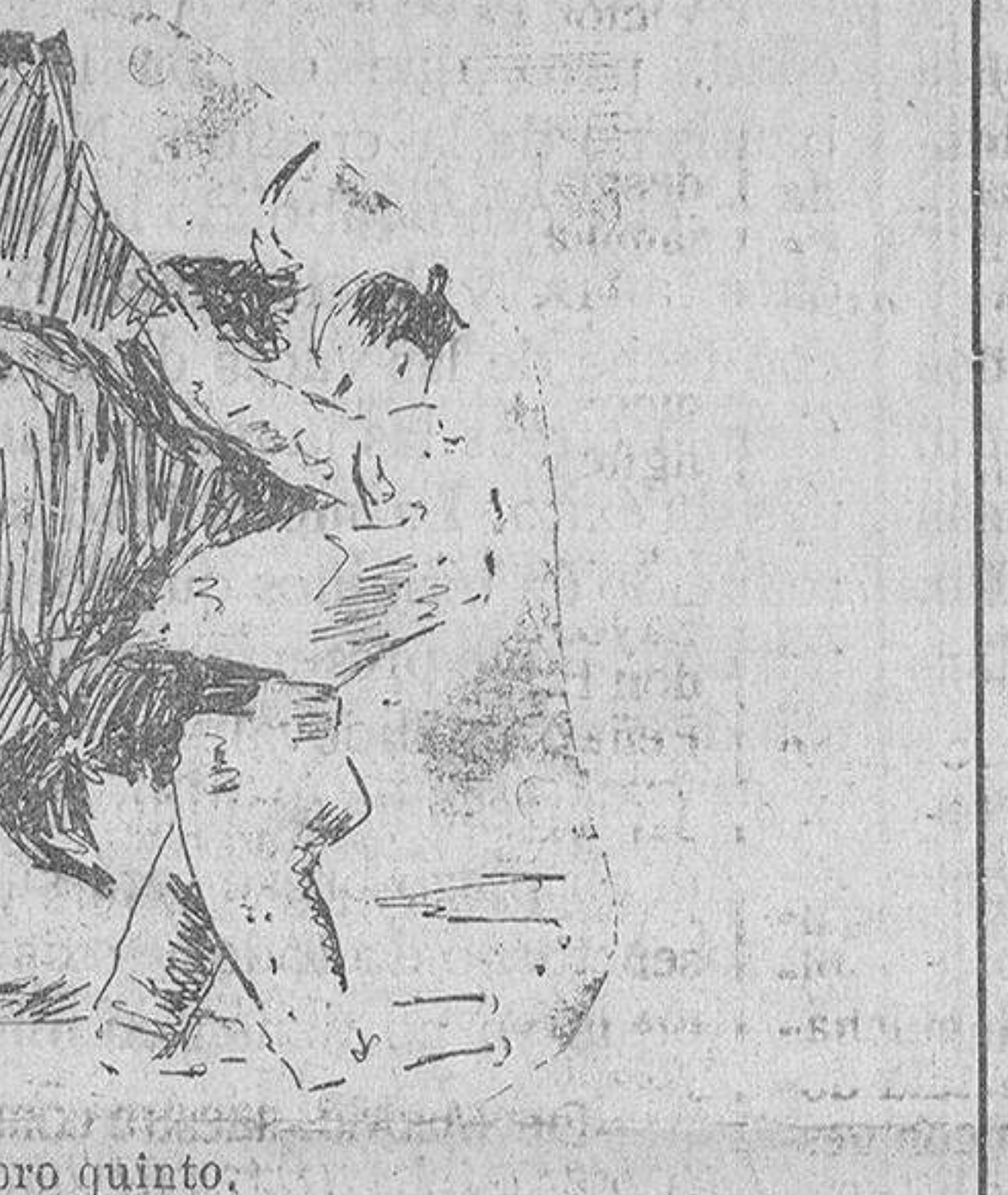
Maera en el toro quinto.

Llegó a sus manos ya agotado, por un enorme y cruel puyazo, dado con toda alevosía, el primer toro. Y Maera aprovechó la nobleza del animal, que apenas podía ya con sus muchos kilos, para hacer una faena valiente y cerca, vistosa, con rodillazos y pases altos y en redondo, un poco movido, por media estocada alta, un poco despreñada, y dos descabellos. Y en el segundo, la faena fué más vistosa, más completa y artística, para atizar media estocada su-