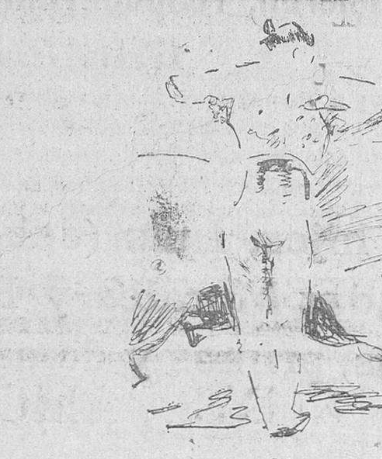
Valencia II en el sexto.

«¡Mire usted que salir presumiendo de haber asesinado a tres toros, de no haberlos querido ni ver, de no torearlos como es debido, y de una oreja por una faena rabiosilla, comenzada en los tercios de afuera y terminada encerrán-