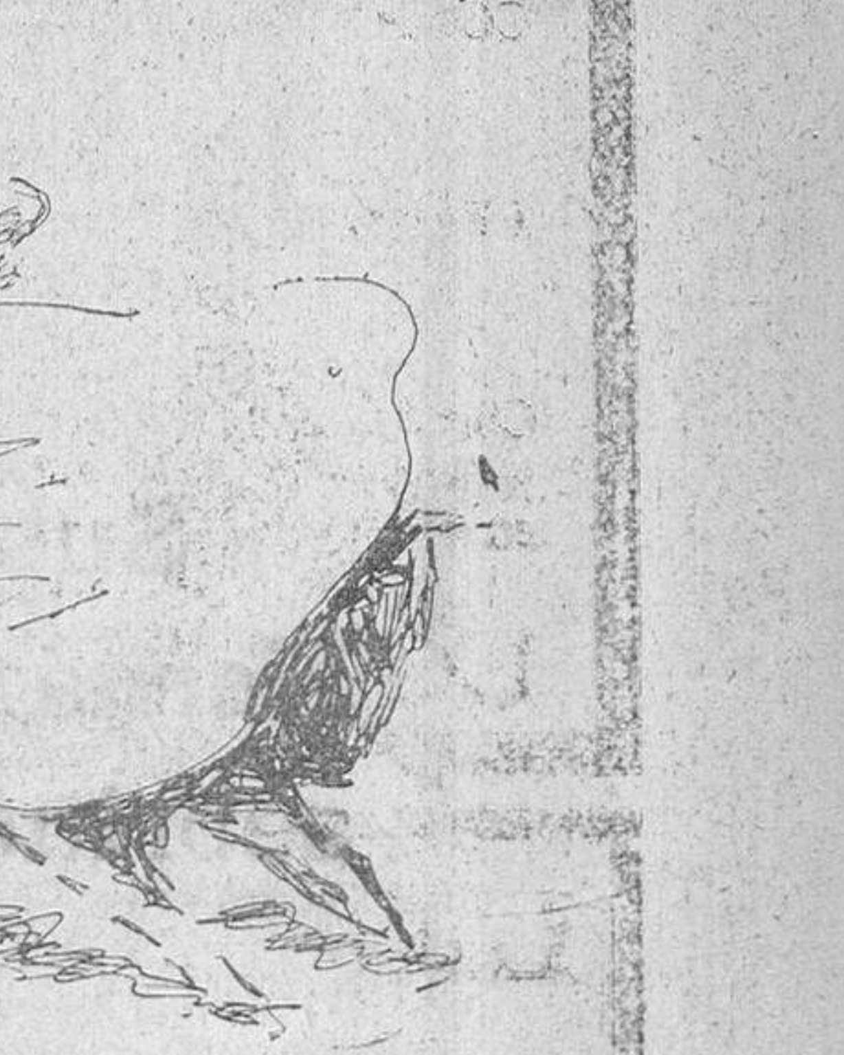
Valencia II en el sexto.