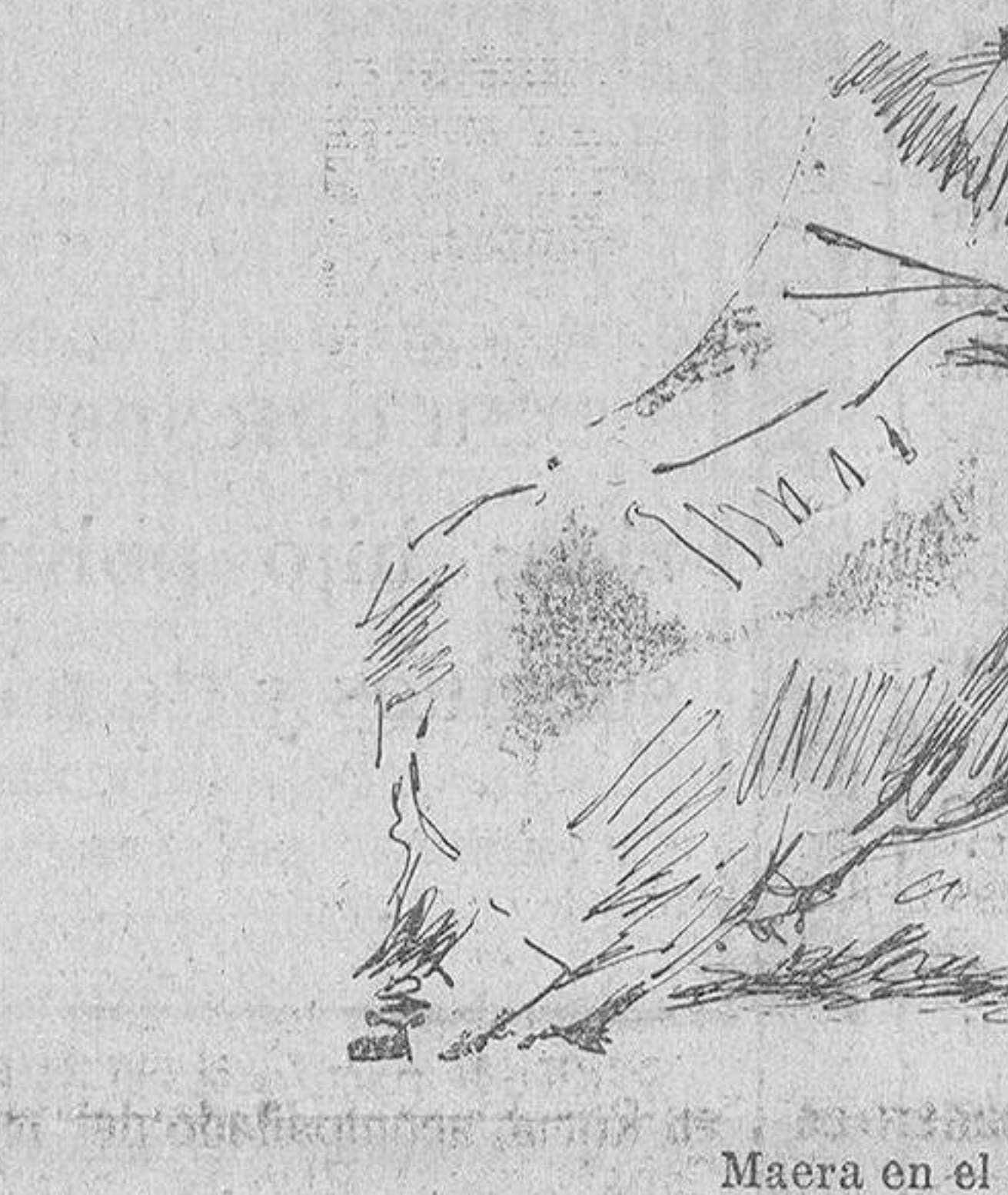
Maera en el toro quinto.

turales y los de pecho, y uno por alto formidable, dados quieto y erguido, con la zurda, ¡valieron la ovación!