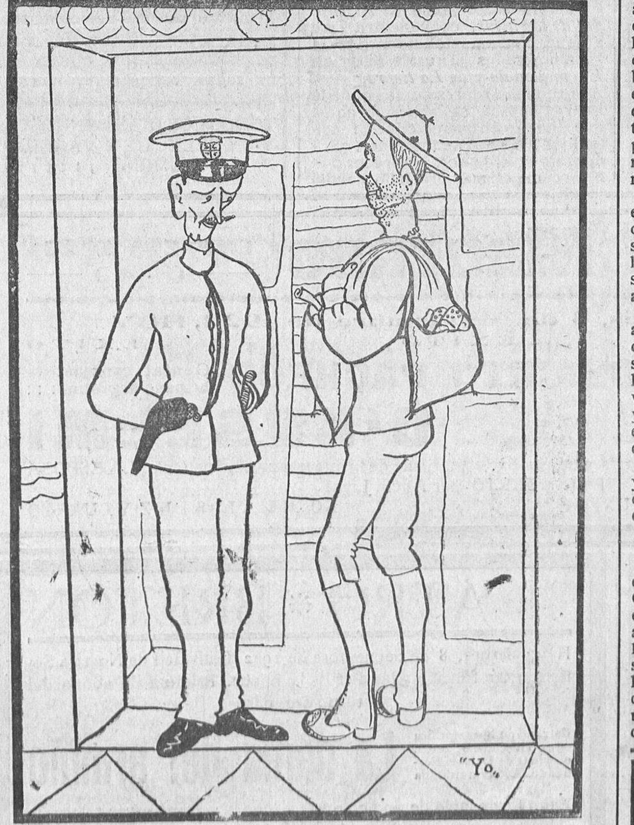
El forastero.—¿Cuesta algo la entrada a la sesión? El guardia.—La entrada no cuesta nada, pero la salida le puede costar a usted un disgusto.