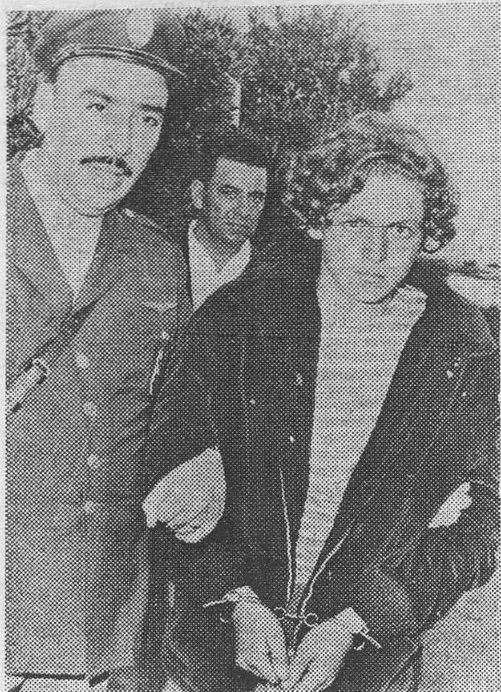
Un peligroso delincuente juvenil es capturado por la Policía.

El materialismo con su culto al placer impulsa a muchos jóvenes a buscarse el dinero por las malas