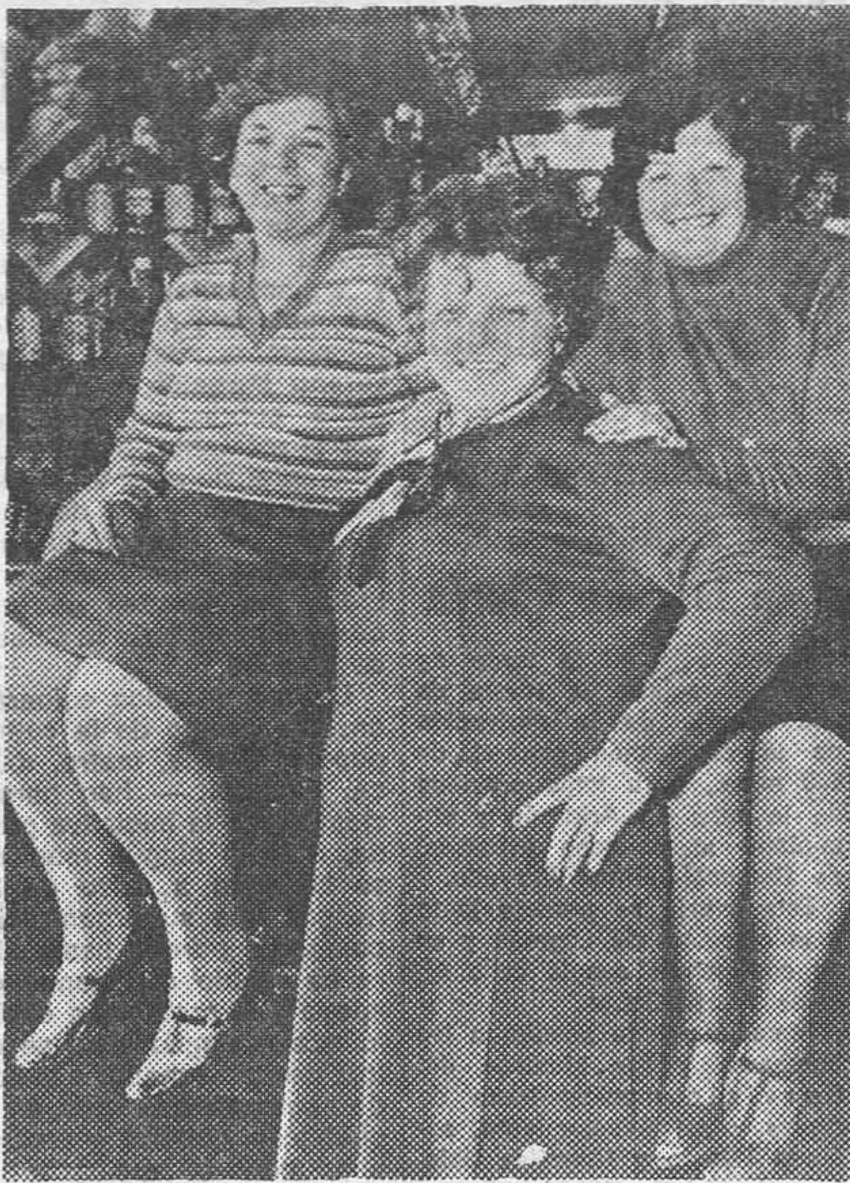
La obesidad, un problema que no siempre se toma con tanta filosofía como lo hacen estas tres robustas y sonrientes damas.

¿Es la obesidad la única causa de sobrecarga en el peso? No lo es. Sin duda, se distingue fácilmente un aumento de peso debido a una hidropesía (edemas de origen cardíaco, renal o hepático, derramamientos en la pleura o en el peritoneo). No obstante, en el peso global de cada uno de nosotros interviene el del esqueleto, que no es mensurable, y sobre todo el de la musculatura. Un atleta en entrenamiento alcanza a veces un peso que equivocadamente lo haría ser considerado como obeso; la hipertrofia muscular puede elevar su peso un 25 por 100, si se otorga confianza a ciertos autores. Pero no hay confusión posible entre masa muscular y masa