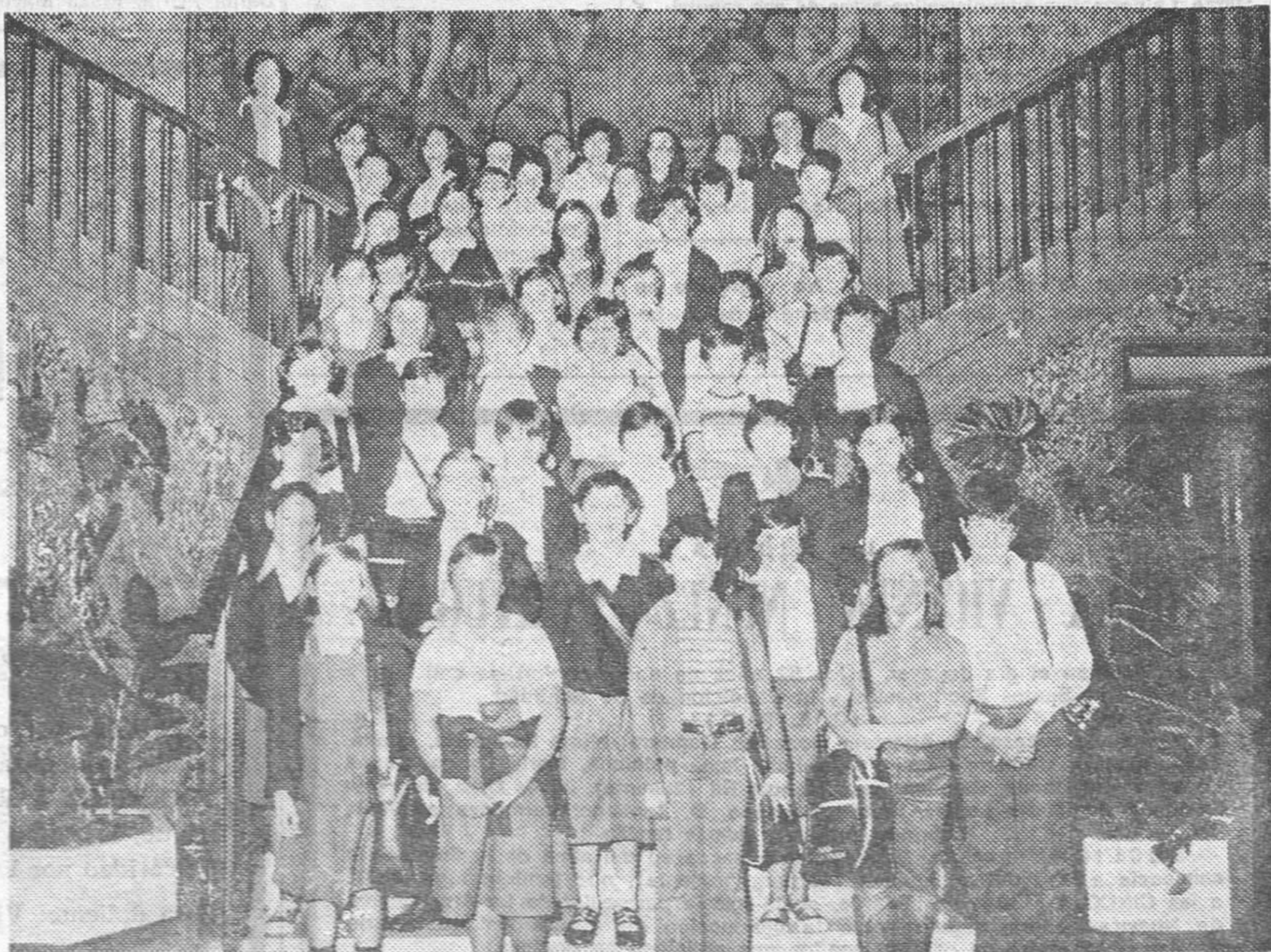
Grupo de 50 niñas de Burgos, capital y distintos puntos de la provincia que el pasado día 13 de Agosto, partieron para asistir al 4.º turno de la Colonia Infantil Marítima de Fuenterrabia (Guipúzcoa) de la Caja de Ahorros del Círculo Católico