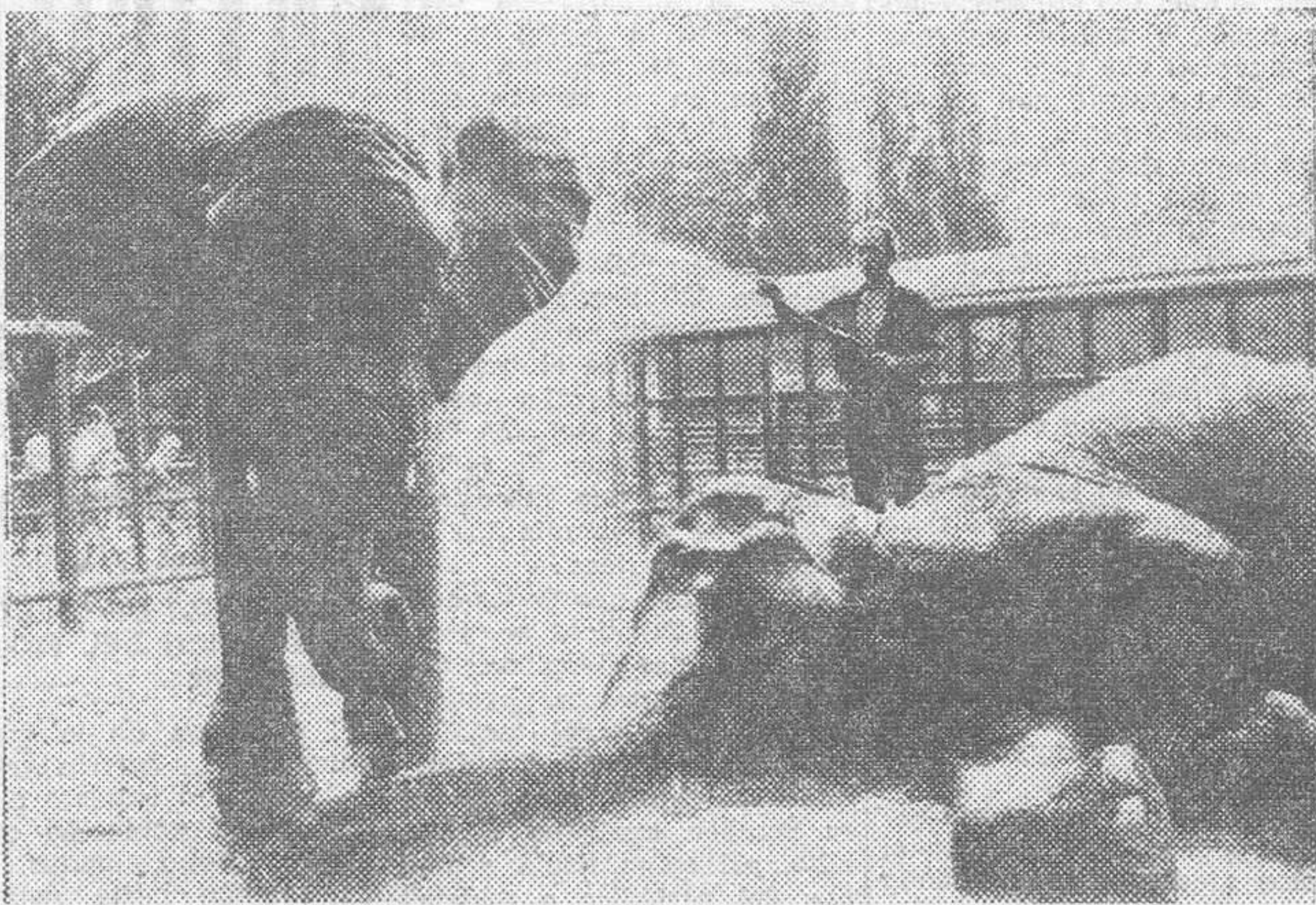
El calor continúa apretando en la temporada estival y los elefantes, que no son menos que los demás, necesitan una buena ducha de agua fría. La foto corresponde a dos viejos elefantes muy populares en el zoológico de Berlín.