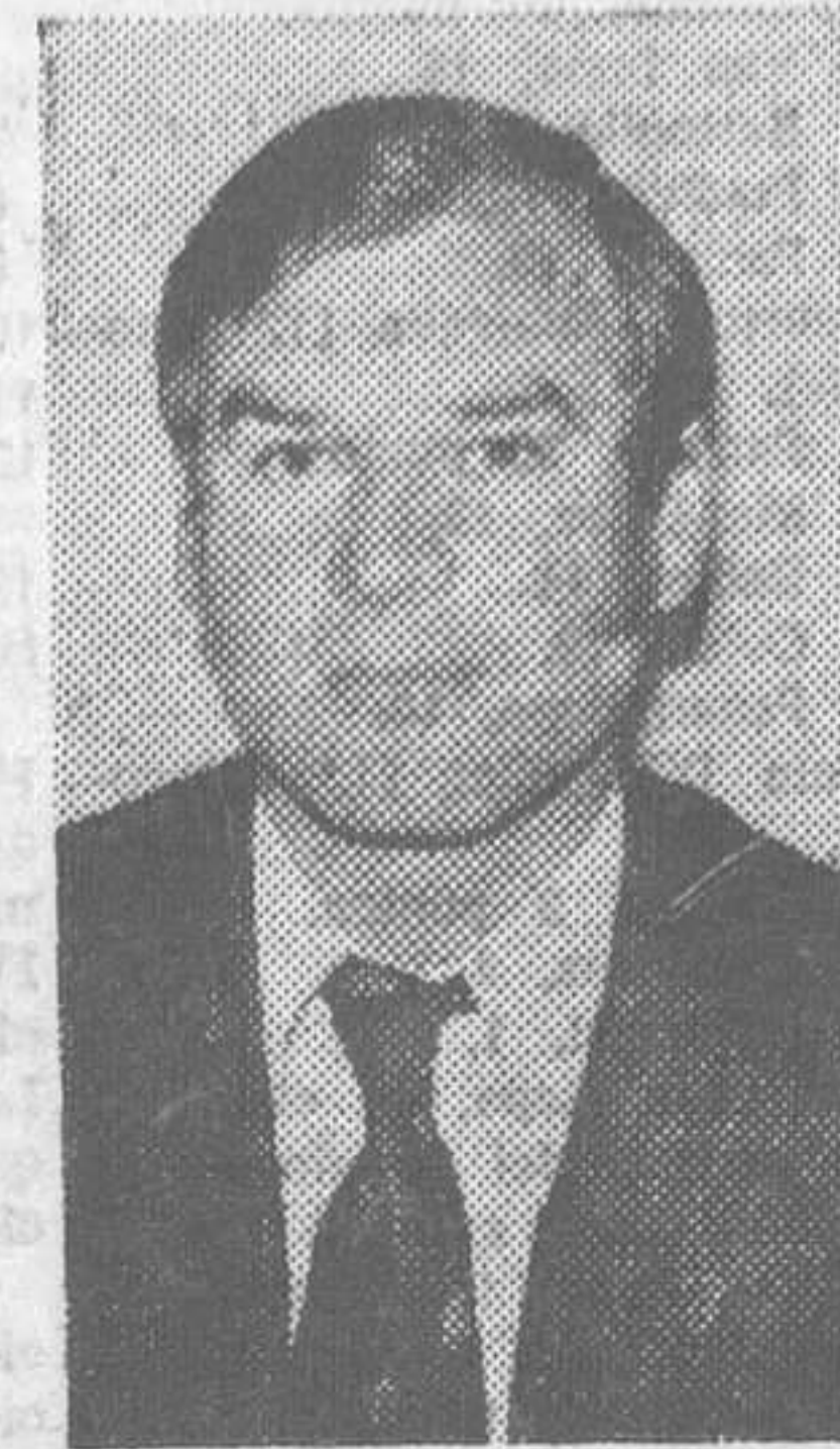
Que así sea y que el atletismo sea revitalizado como se merece. Cada cual saque las consecuencias a su manera, aunque las conclusiones son bien claras.