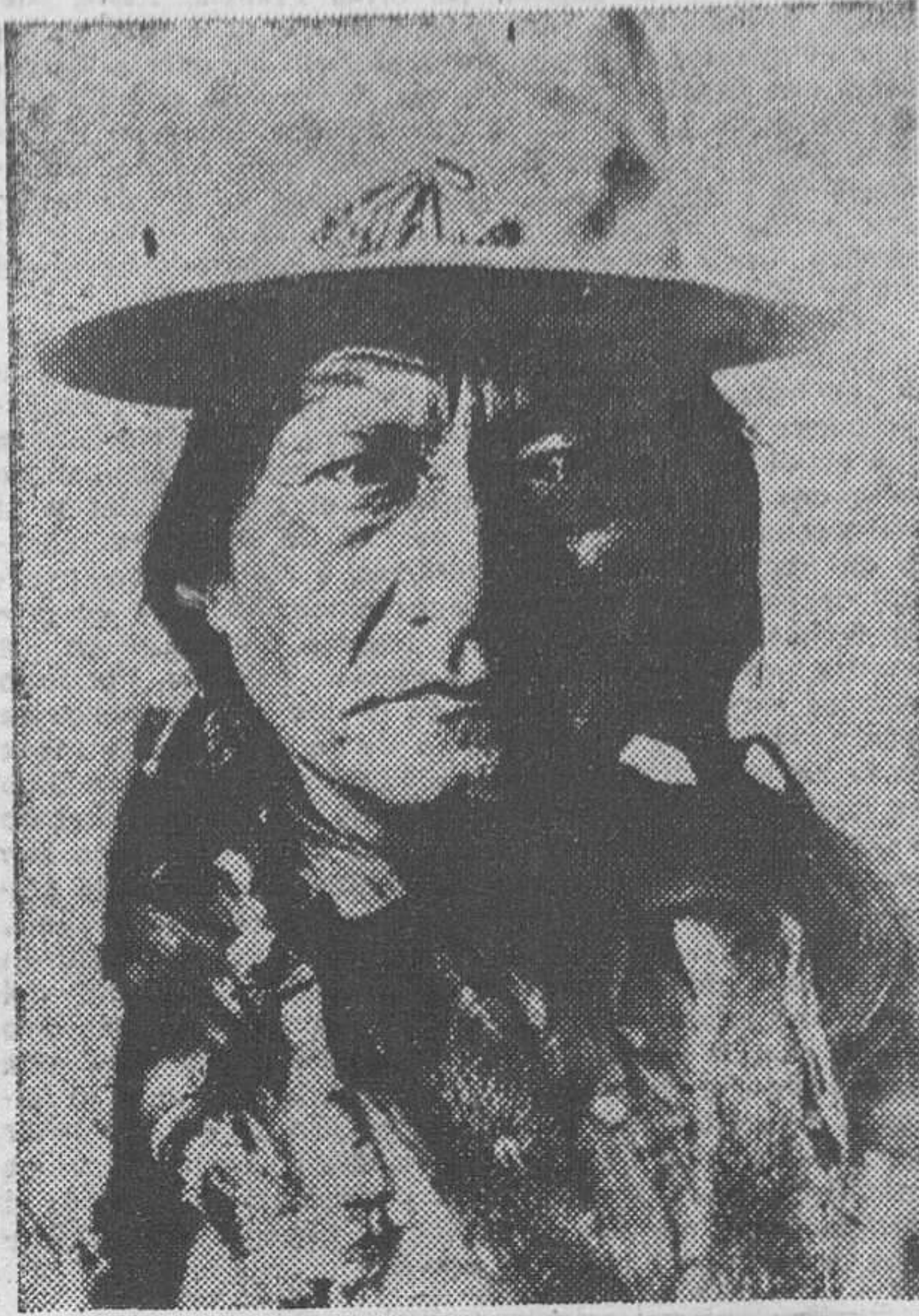
Sitting Bull o Toro Sentado, el célebre jefe piel roja, causante de que el general Custer y sus soldados "murieran con las botas puestas.