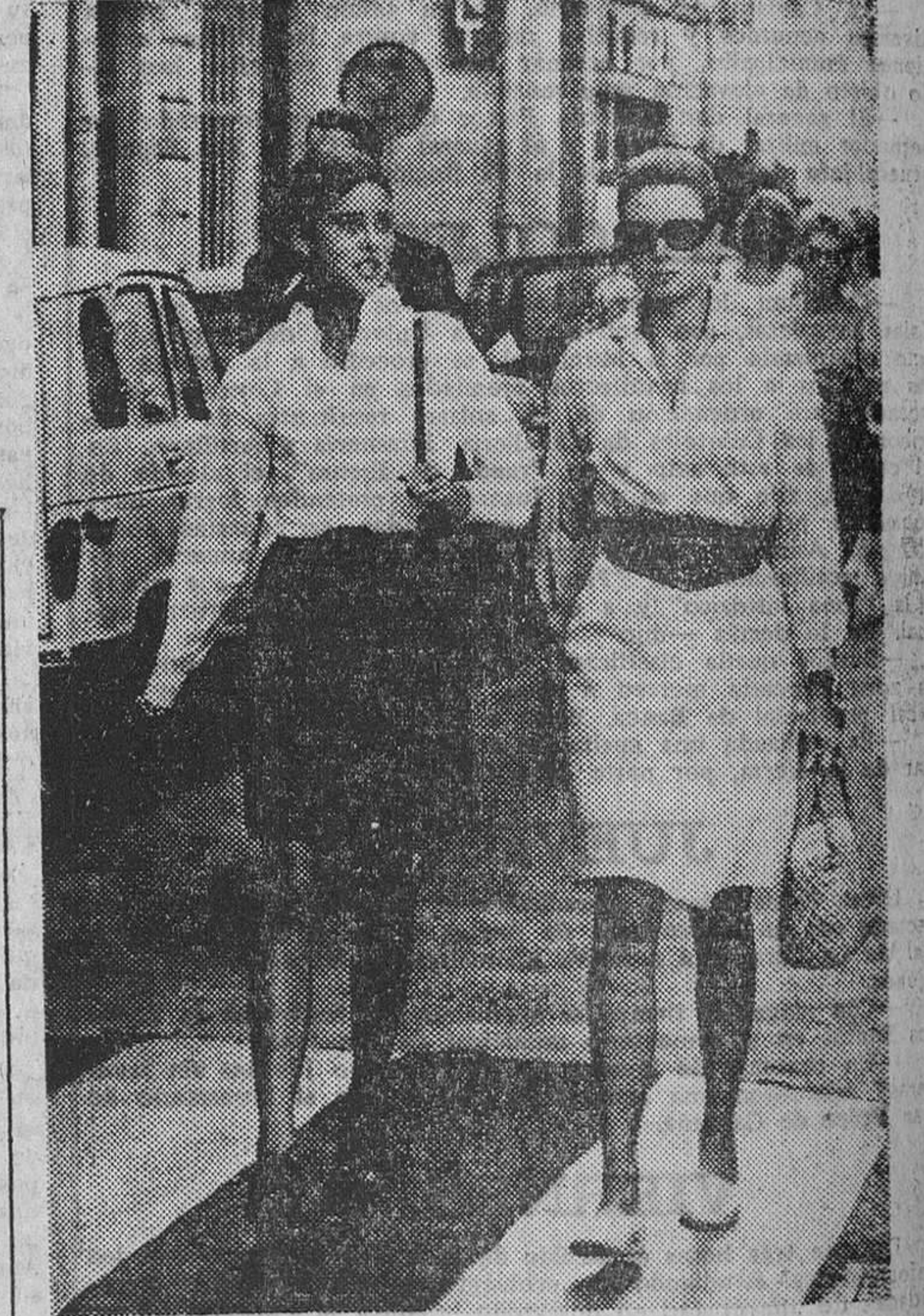
La Princesa Grace en unión de su hija Carolina. La Princesa lucha ahora con problemas de línea.—(Foto EFE-FIEL).

Louis Perousin (Copyright Fiel - Servicios Especiales de EFE - DERL).