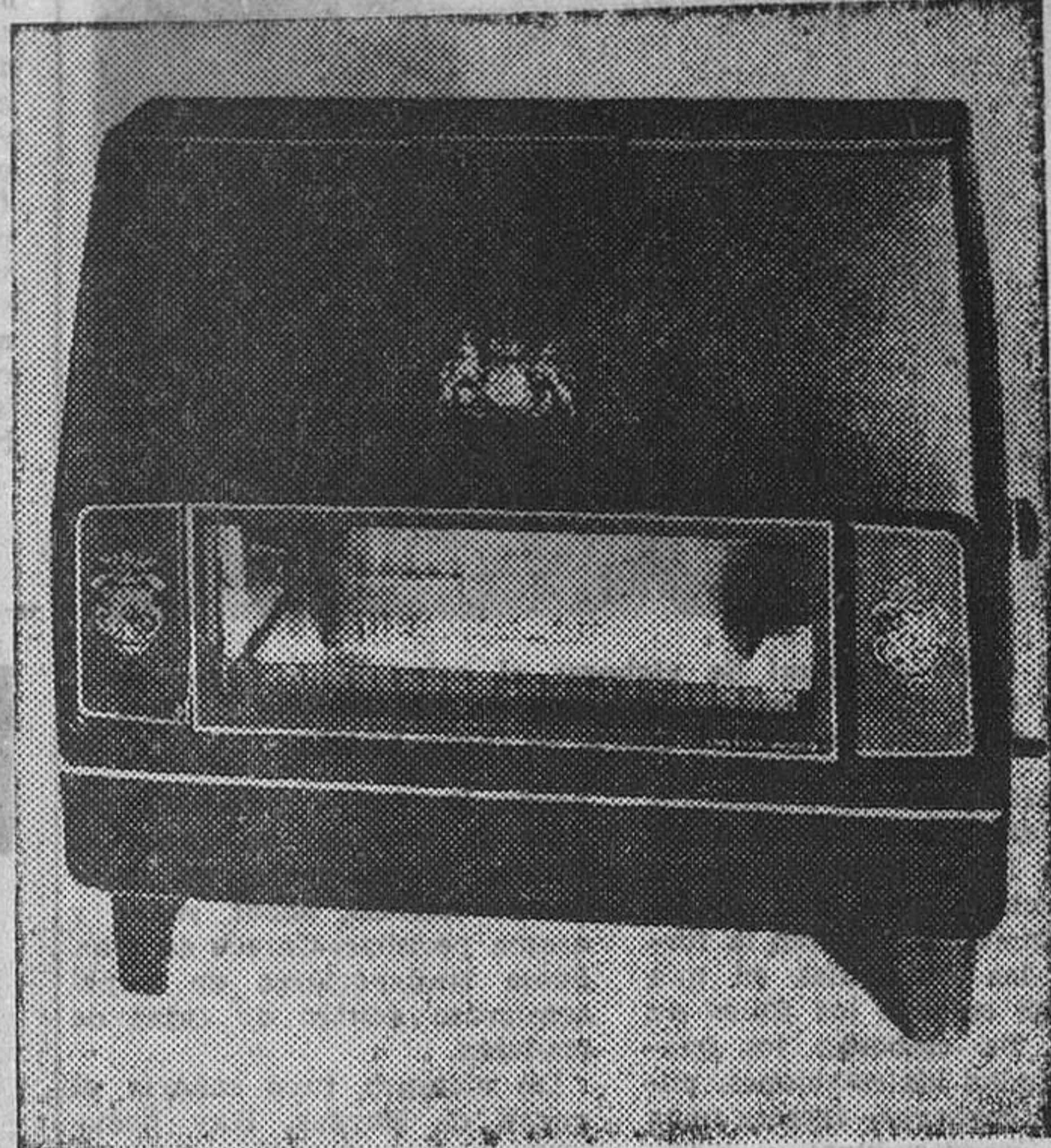
Estufa de gas de último modelo que, recuerda, sin embargo, a las antiguas y clásicas chimeneas.

CHARLOTTE RIX (FIEL) - Servicios especiales de EFE-AFP.