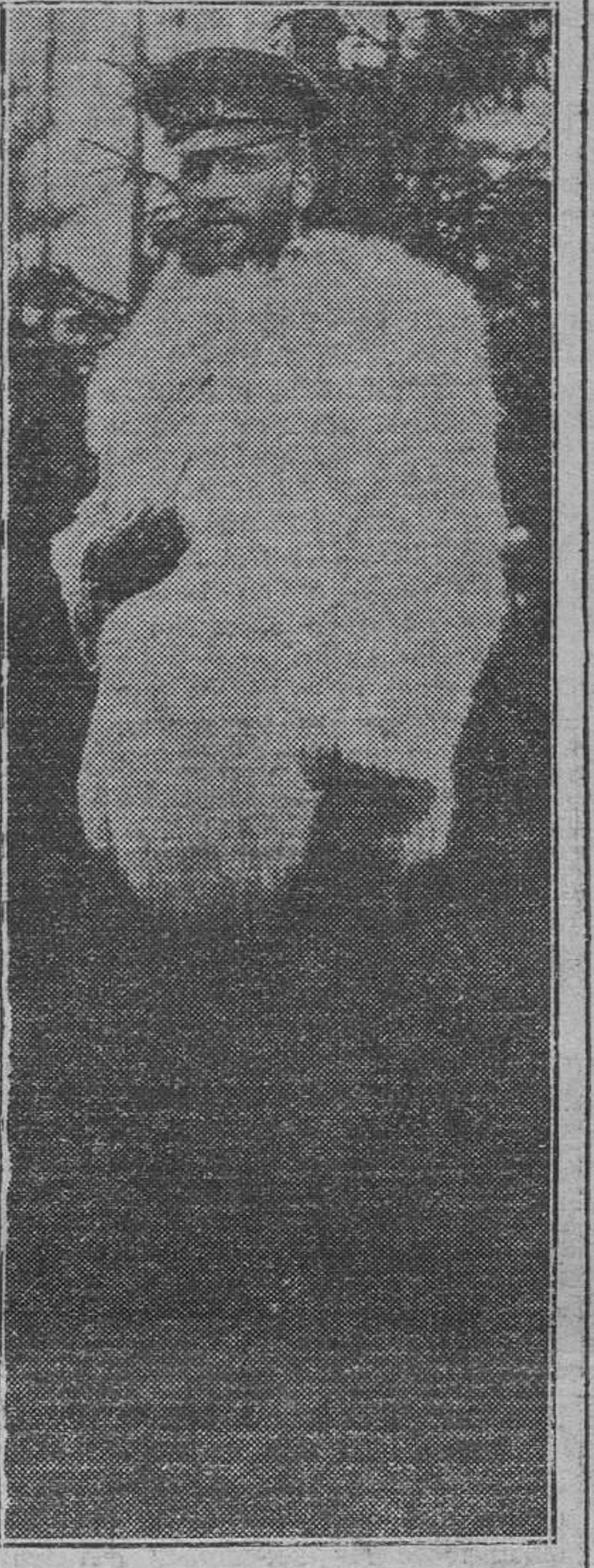
Franenstein, en traje de campaña, durante la Gran Guerra

Sicilia y las secretas maquinaciones del Rey de Nápoles. Una nueva tempestad alejó de las costas africanas a las dos flotas, que ya desorganizadas, tuvieron que dar por terminada su misión. Un doctísimo historiador, el Padre Andrés Ivars, de la Orden de San Francisco, ha publicado un minucioso trabajo sobre estas cruzadas, por cierto en lengua valenciana. JORDI DE FENOLLAR