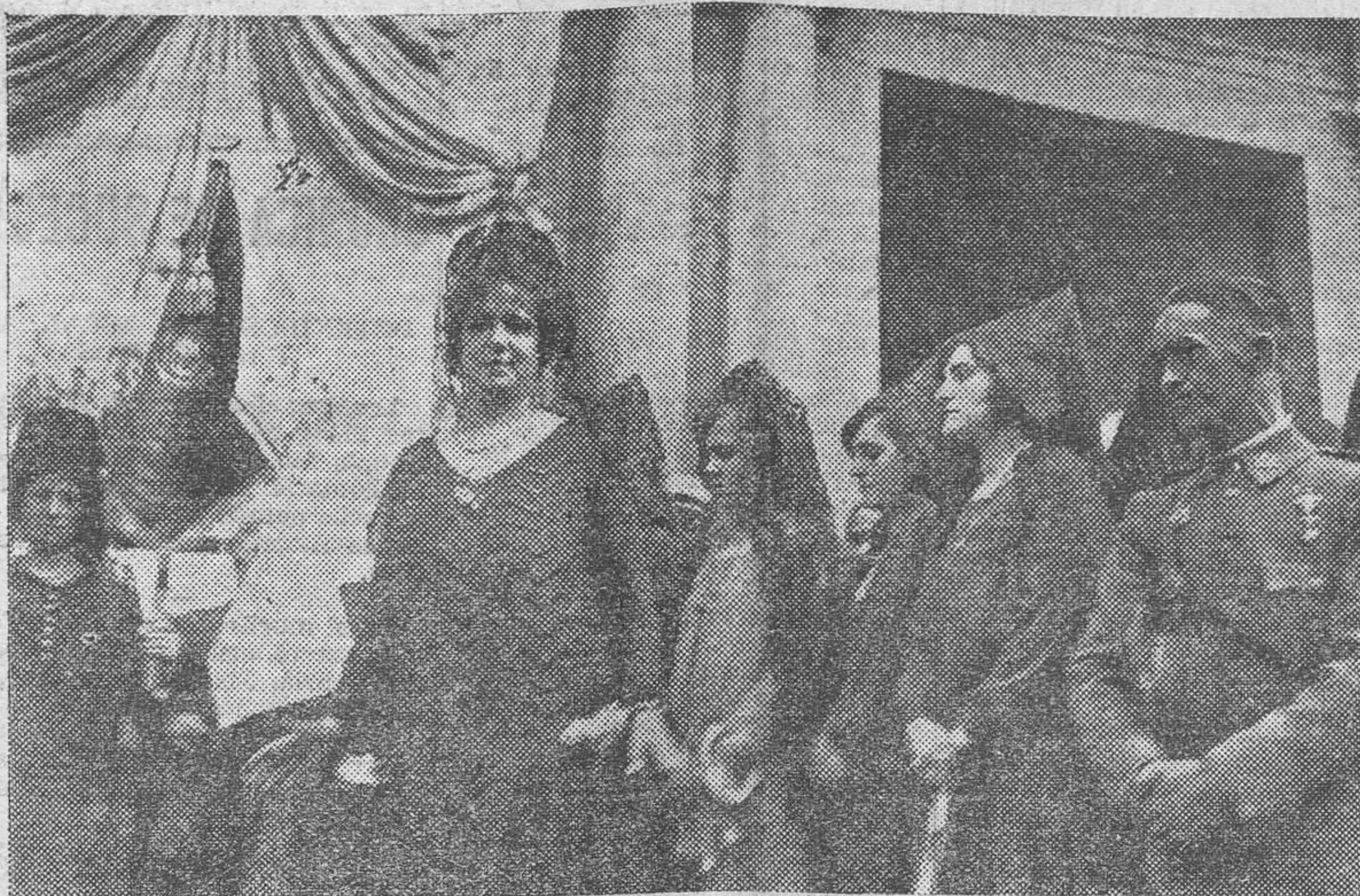
La ilustre asambleísta, madrina en la bendición del estandarte del Somatén del partido, dirigiendo la palabra al concurso.