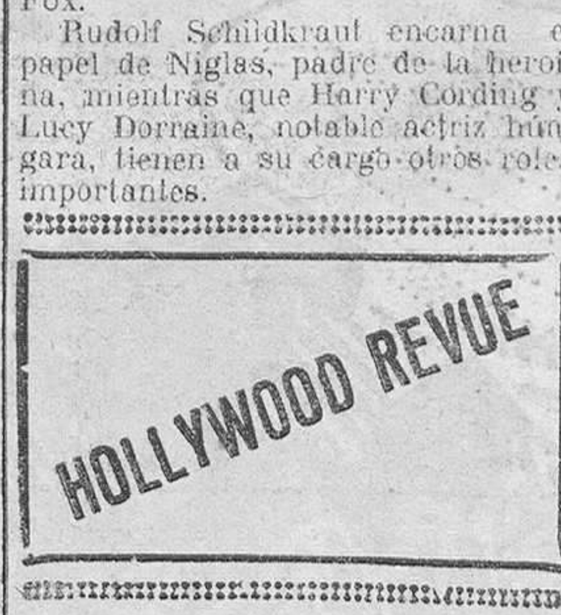
Estreno de la película muda que armará más ruido de la temporada