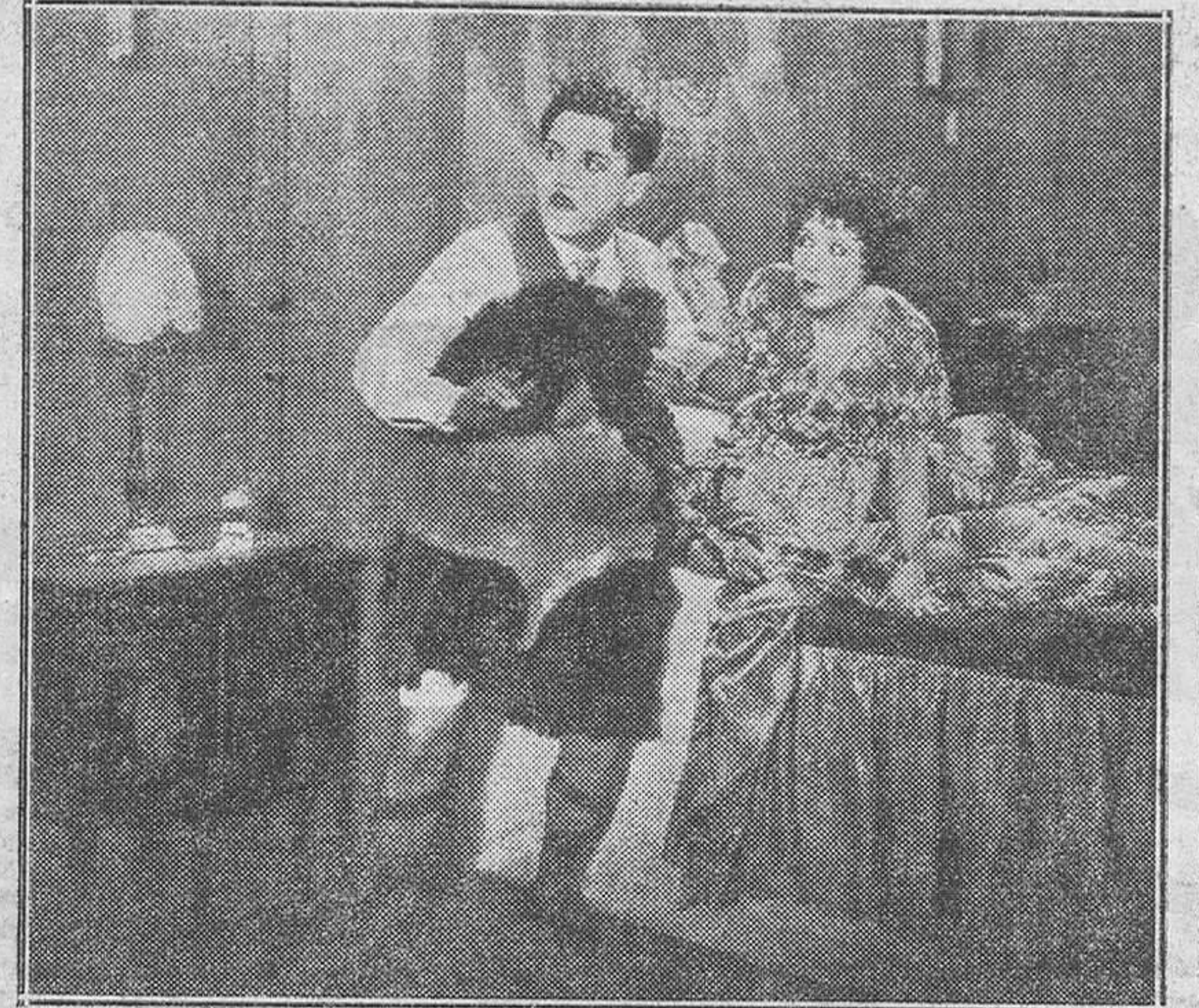
Una escena de la comedia frívola «La manzana de Adán», en la que hacen un dúo cómico de gracia Monty Banks y Gillian Dean